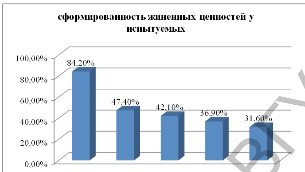
Рисунок 2 – Сформированность жизненных ценностей у испытуемых экспериментальной группы.

сти (84,2% от числа всех испытуемых), далее идут ценности личной жизни (47,4%), ценности принятия других людей (42,1%), ценности профессиональной реализации (36,9%) и, наконец, ценности самоутверждения (31,6% от числа всех испытуемых) (рис. 2).