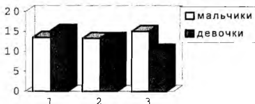
Рис. 2. Частота использования самозащитного типа реакций младшими подростками

Девочки младшего подросткового возраста, переоценивающие свое положение в группе сверстников, значительно чаще ( p \leq 0,05 ) используют самозащитный тип фрустрационных реакций, так же свидетельствующий о несвободе человека от фрустрации (рис. 2). Наименьшая частота использования данного типа реакций отмечается у группы девочек, точно оценивающих свое положение в группе сверстников. Группа девочек, недооценивающих свое положение, по частоте использования данного типа фрустрационных реакций, занимает промежуточное положение между группами девочек, недооценивающих и точно оценивающих свое положение в группе сверстников. Средняя оценка данного типа реакций, определяемая в группе девочек, недооценивающих свое положение в группе сверстников, равна 13,25; в группе девочек, переоценивающих свое положение – 15,2; в группе девочек, точно оценивающих свое положение – 10,3. Среди выделенных групп мальчиков по частоте использования самозащитного типа фрустрационных реакций следует отметить группу мальчиков, точно оценивающих свое положение.