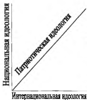
Рис. 1. Патриотическая идеология

Из сопряжения двух идеологических составляющих вытекает, что в качестве равнодействующей будет патриотическая идеология. И как только равнодействующая приближается к национальной идеологии, то происходит «сваливание» к национализму. И, наоборот, приближение равнодействующей к интернациональной идеологии неизбежно приводит к космополитизму. И то, и другое плохо и вредно, и оказывает негативное влияние на патриотическую социализацию современного поколения. Схематично сопряжение двух идеологических составляющих патриотической идеологии изображено на рис. 1–3.