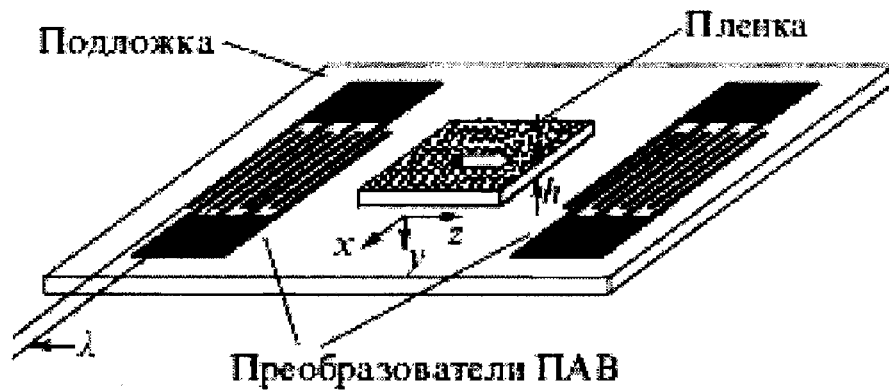
Рис. 1. Принципиальная схема высокочастотного пьезоприемника.

Усиление ПАВ электрическим током в слоистых структурах пьезоэлектрик-полупроводник наблюдалось впервые в работах К. Иошиды и М. Ямениши, К.Ф. Куэйта, Дж.Г. Коллинза, К.М. Лэйкина, Г.М. Жерара и Дж.Г. Шо, К. Фишлер и С. Яндо, Ю.В. Гуляева, А.М. Кмиты, И.М. Котелянского, А.В. Медведя, Ш.С. Турсунова и др. [1–5]. Детальная теория поглощения и усиления ПАВ, а также акустоэлектрического эффекта в пьезоэлектрических полупроводниках и слоистых структурах пьезоэлектрик-полупроводник представлена в [2]. Поверхностная акустическая волна распространяется вдоль поверхности твердого тела с относительно малой скоростью и доступна в любой точке на пути ее распространения. Таким образом, с сигналом в виде ПАВ можно контактировать, влиять на него, преобразовывать, усиливать, отводить часть энергии и т.д. Так как длина волны ПАВ примерно в 10^5 раз меньше длины электромагнитной волны той же частоты, вся обработка сигнала в виде ПАВ происходит на расстояниях в несколько сантиметров и даже миллиметров. Подбирая соответствующим образом амплитуды и фазы отведенных сигналов, можно построить, в принципе, любую амплитудно-частотную характеристику (АЧХ) такого пьезопреобразователя. Для формирования требуемой АЧХ приемника можно применить вариацию длины перекрытия электродов гребенок в встречно штыревом пьезоприемнике (ВШП), так называемую «аподизацию». В идеальном случае АЧХ такого ВШП есть Фурье-преобразование от перекрытия электродов как функции координаты вдоль пути распространения в ПАВ.