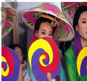
Ил. 11. Веера «Тайцзи».

В странах Азии всегда уделяли большое внимание танцу как некоему ритуалу. Традиционная форма корейского танца обычно исполняется группой танцовщиц. Часто этот танец является обязательным элементом многих культурных и прочих мероприятий в Южной Корее. Танцующие надевают национальный костюм «ханбок», а в руках держат яркие веера «Тайцзи» из перьев (ил. 11).