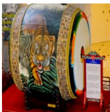
Ил. 6. Барабан-символ «Тайцзи» с изображением тигра.

Барабан-символ «Тайцзи» и деревянное изображение рыбы-дракона подвешивается рядом с барабаном во время церемоний (ил. 7).