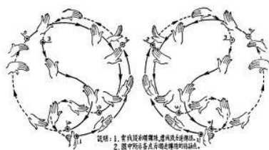
Ил. 2. Движения рук «Тайцзицюань».

«Тайцзицюань» как часть философии «Тайцзи» включает в себя боевое искусство, которое основывается на восьми базовых движениях рук: 1. Отражение (кит. 棚 «пень»). 2. Возврат в исходное положение (кит. 掣 «люи»). 3. Сдавливание (кит. 挤 «цзи»). 4. Толкание (кит. 按 «ан»). 5. Хватание (кит. 采 «цай»). 6. Разведение (кит. 捌 «ле»). 7. Использование локтей (кит. 肘 «жоу»). 8. Протягивание (кит. 靠 «као») (ил. 2).