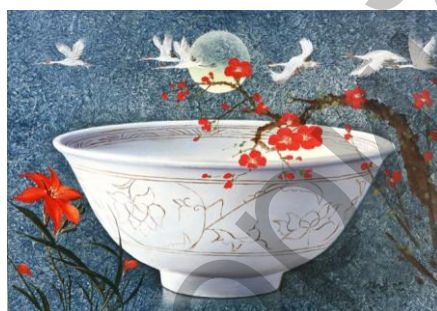
Ил.13. Картина «Гармония» современного корейского художника Joо Seok Ju.

Современного корейского художника Joо Seok Ju по праву можно назвать «темной лошадкой» корейского искусства, который приобрел известность благодаря изображению символа «Тайцзи» на своих картинах. На его картине под названием «Гармония» на фоне луны изображены гуси. Большая чаша и луна символизируют круг символа «Тайцзи» (ил. 13).