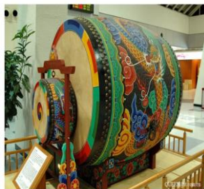
Ил. 5. Барабан-символ «Тайцзи» с изображением дракона.