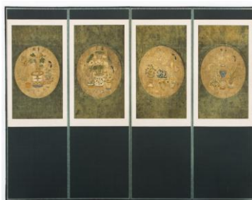
Ил. 16. Ширма «Тайцзи».

Интересен процесс распространения «Тайцзицюань» в США. Хотя США по географическому положению находится довольно далеко от материкового Китая, но время проникновения «Тайцзицюань» в США вовсе не является поздним. В соответствии с записями в соответствующей литературе, последователь «Тайцзицюань» Цайхэ Пэн (кит. 蔡鹤朋, стиль Ян) в 1939 г. Отправляется в США, где в Сан-Франциско, Лос-Анджелесе, Нью-Йорке и других местах основывает клубы по «Тайцзицюань», в которых в то время все ученики являлись китайцами-эмигрантами. В 1963 г. Эдвард Мейзел (Edward Maisel американец) выпускает первое издание «Тайцзицюань: стиль Ян» на английском языке. Сильный интерес к развитию «Тайцзицюань» в США стимулировали множество мастеров из Китая, которые внесли большой вклад в распространение восточного учения в американской среде. В 1999 г. супружеская пара Дуглас (Bill Douglas) и Анжела Вон (Angela Wong) в городе Канзасе стали инициаторами мероприятия «Дни Тайцзицюань в мире», которое получило признание Всемирной Организации Здравоохранения, каждый год дни последней недели в апреле признаны «днями Тайцзицюань». Как показывают соответствующие данные, вплоть до 2007 г. во всех США уже 2,3–3,0 млн человек изучают «Тайцзицюань» [5].