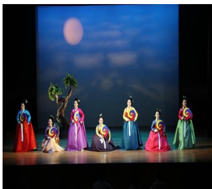
Ил. 12. Новый традиционный танец Кореи.

Современного корейского художника Joо Seok Ju по праву можно назвать «темной лошадкой» корейского искусства, который приобрел известность благодаря изображению символа «Тайцзи» на своих картинах. На его картине под названием «Гармония» на фоне луны изображены гуси. Большая чаша и луна символизируют круг символа «Тайцзи» (ил. 13).