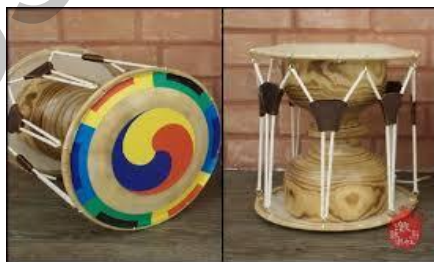
Ил. 4. Барабан-символ «Тайцзи».

Барабан-символ «Тайцзи» (кит. 太极鼓), или «Чангу» (кит. 杖鼓 «корейский ритуальный барабан»), традиционный корейский ударный музыкальный инструмент, который состоит из деревянного полированного (иногда также лакированного) корпуса и 2 стянутых шнурами кожаных мембран. По форме напоминает песочные часы или две рюмки, поставленные вертикально одна над другой и соединенные основаниями коротких ножек (ил. 4) [3, с. 45].