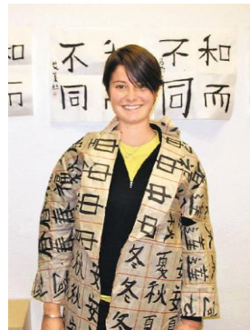
Ил. 19. Американская студентка, изучающая китайскую каллиграфию.

Заключение. Соответствующих исторических материалов по древней китайской философии «Тайцзи» довольно мало, современным китайским философам на основе сохранившихся данных