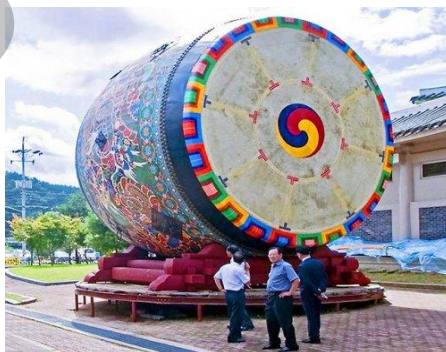
Ил. 8. Самый большой в мире барабан-символ «Тайцзи».

Диаметр самого большого в мире барабана-символа «Тайцзи» составляет 6,4 метра. Такой барабан был создан в южнокорейском городе Йондоне (ил. 8).