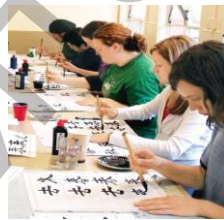
Ил. 18. Американские студенты изучают китайскую каллиграфию.

С июня 2006 г. «Ассоциация по Обучению китайской каллиграфии» в США и «Ассоциация китайской каллиграфии и живописи» в Шанхае организовали три «выставки произведений каллиграфического искусства китайских и американских студентов» [6, с. 15]. Главная цель «Ассоциация по Обучению китайской каллиграфии» – продвигать и содействовать обучению китайской каллиграфии. Председатель «Ассоциация по Обучению китайской каллиграфии» Ту Синши (кит. 屠新时) считает, что китайская каллиграфия – неотъемлемая часть мирового искусства и необходимо позволить еще большему количеству людей понимать и разделять это искусство. Американские студенты посредством изучения каллиграфии осваивают традиционную культуру, понимают «идеи гармонии» в философии «Тайцзи» (ил. 18–19).