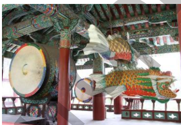
Ил. 7. Барабан-символ «Тайцзи» и деревянное изображение рыбы-дракона.

Барабан-символ «Тайцзи» и деревянное изображение рыбы-дракона подвешивается рядом с барабаном во время церемоний (ил. 7).