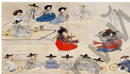
Ил. 10. Картина «Танцы с двумя мечами», художник Шэнь Жунь Фу.

Древние корейские художники часто изображали музыкальный инструмент – барабан-символ «Тайцзи». Например, один из музыкантов, изображенных на картине «Танцы с двумя мечами» художника Шэнь Жунь Фу (кит. 申润福 1758 – начало XIX в.) (ил. 10), играет на барабане-символе «Тайцзи».