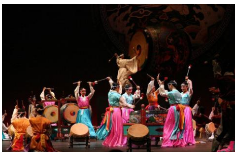
Ил. 9. Корейский традиционный большой барабанный ансамбль.

Древние корейские художники часто изображали музыкальный инструмент – барабан-символ «Тайцзи». Например, один из музыкантов, изображенных на картине «Танцы с двумя мечами» художника Шэнь Жунь Фу (кит. 申润福 1758 – начало XIX в.) (ил. 10), играет на барабане-символе «Тайцзи».