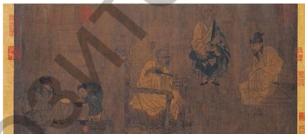
Ил. 15. Живопись «Сяо И пытается выманить “Свиток Павильона Орхидей”».

Живописная работа этого художника «Сяо И пытается выманить “Свиток Павильона Орхидей”» (кит. 《萧翼赚兰亭图》) является первой работой в мире, посвященной чаю. На ней изображены конфуцианец и два монаха, которые вместе пьют чай. Справа – монахи и конфуцианец разговаривают о сути буддизма и конфуцианства в ожидании чая. Слева – двое слуг, старый и молодой, сосредоточенно готовят чай. Старый слуга ставит чайник на очаг и тщательно заваривает чай, а молодой в это время держит чашу, ожидая, когда можно будет подать ее своему господину. Персонажи картины выглядят как живые: сама картина написана очень тщательно, она отражает чрезвычайно простой образ жизни, который был присущ рядовым монахам и конфуцианцам. Это произведение ценно по той причине, что на ней не просто запечатлен процесс приготовления чая и чаепития, а заключен глубокий смысл. Полотно отражает ту мысль, что буддисты и конфуцианцы за чаем обсуждали философские проблемы. Поэтому становится ясно, что беседа за чашкой чая гораздо важнее, чем просто заваривание и употребление чая (ил. 15) [4, с. 40].