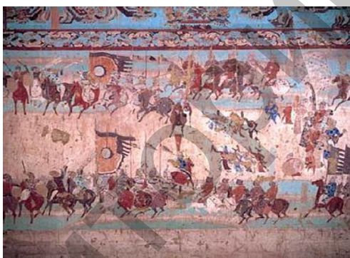
Ил. 12. Шествие главнокомандующего.

Симфоническая картина «Дуньхуан» состоит из семи пьес: «Ветряные колокольчики пещеры Могао», «Шествие главнокомандующего», «Танец Западной Лян», «Озеро Юэяцюань», «Дуньхуанская ярмарка», «Летящие апсары», «Дары Дуньхуана». «Ветряные колокольчики пещеры Могао» привлекают путников войти, завлекая их уносящими в далекое прошлое радостными воспоминаниями, в спокойной музыке наблюдается динамика, она простая и точная. Мелодия «Шествия главнокомандующего» величественная и грандиозная. Она живо передает величественную сцену отправления в поход командующего поздней династии Тан Чжан Ичао, сцены ожесточенных сражений. Музыка довольно напряженная. Мелодия «Танца Западной Лян» прекрасна, энергична по ритму, обладает густым колоритом Западных земель. Уникальное лирическое адажио «Озера Юэяцюань» подобно грезам, имеет свои особые характерные черты. «Дуньхуанская ярмарка» – это радостное и лаконичное аллегretto. Оно рисует картину, как различные народности мирно сосуществуют на «шелковом пути», цветущие сцены дружеского обмена. Музыка «Летящих апсаров» живая и туманная, необычно красивая, наполнена романтическим колоритом, словно обманчивый пейзаж [7].