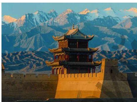
Ил. 9. Дуньхуан.

Симфоническая картина «Дуньхуан». Одним из новейших произведений явилась Симфоническая картина «Дуньхуан».