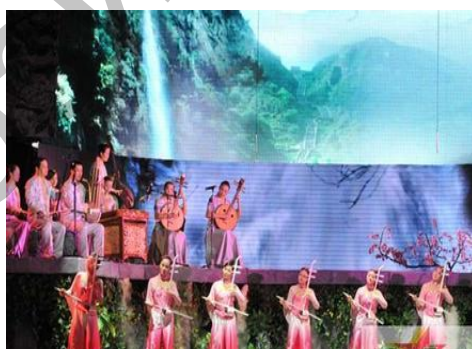
Ил. 7. Выступление симфонической картины «Гора Тайшань».

Симфоническая картина «Гора Тайшань». Особое место в современном китайском музыкальном искусстве занимает масштабная национальная симфоническая картина «Гора Тайшань», которая впервые была исполнена на сцене Национального Большого театра 10–11 сентября 2011 г., была совместно создана режиссером Лю Жуном (композитор, исполнитель музыки на эрху), известными композиторами Чжао Цзипином, Лю Вэньцзином, Чжан Цяни, Чэнь Чуньгуаном, знаменитым писателем Хань Цзингином, признанным дирижером Чжан Шие. «Тайшань» состоит из десяти частей: ансамбль «Море из облаков на рассвете», ансамбль «Сон горных глубин», эрху, пипа, чжэн и оркестр «Извилистая тропа слушает сосну», сюань (соло) «Бойкие лесные птички», эрху