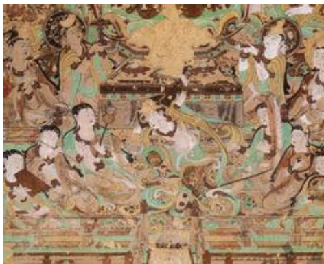
Ил. 11. Фрески Дуньхуана.

воплотить великий Дуньхуан. Сначала эта задача поставила нас в тупик. Сильный толчок нам дали фрески. К которой из фресок родились чувства, ту часть пьесы и писали» [5]. Так нам понадобилось 7 пьес, чтобы позволить слушателю «войти» в Дуньхуан. Композитор Чжан Цзянь сказал: «Фрески Дуньхуана величественны и проникновенны. Сталкиваясь с ними, появляется сильное чувство потрясения, музыка о создании Дуньхуан – это не только разговоры о пещере Могао, но и всестороннее ее раскрытие», – говорит композитор Хань Ланькуй [6].