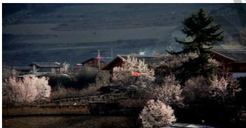
Ил. 1. Весеннее утро в укрепленной горной деревне.

Симфоническая картина «Живой пейзаж горы Юньлин». Это – симфоническая картина с ярко выраженным художественным характером. Она состоит из пяти частей, каждая из которых обладает своими конкретными образами и изображает свой природный пейзаж.