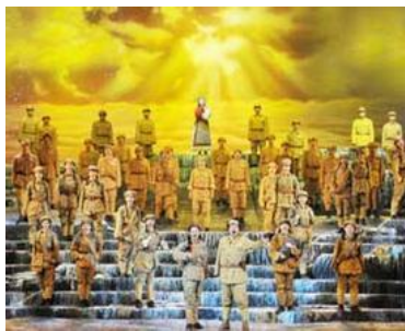
Ил. 4. Исполнение симфонической картины «Северный лес».

Симфоническая картина «Северный лес». В качестве примера можно привести еще симфоническую картину «Северный лес» (композитор Чжан Цяни) – любимое многими произведение с живописными музыкальными образами, глубокой идеей, выразительным стилем и ярким колоритом. Отличительной чертой симфонической картины «Северный лес» является единство образности, поэтичности и мелодичности. Лиричность – основная особенность данного музыкального произведения. Она проявляется в выражении чувств к лесу и воспевании простора и красот родной страны. Экспрессивность выдвигает на первый план дыхание лесной жизни посредством создания музыкальных образов лесных животных. Мелодичность наблюдается в изменении оттенков симфонической картины и развитии человеческих эмоций по отношению к лесу. Благодаря гармоничному соединению утонченной мелодии, живого ритма, прекрасного сочетания оттенков, богатых приемов инструментовки эти три отличительные особенности данного музыкального произведения рисуют перед взором слушателей чудесный образ леса. В музыкальном плане эта живописная симфония может увлечь слушателей, не только потому что автор музыкальной кистью создает живое изображение пейзажа, но и потому что позволяет слушателям с помощью ассоциаций музыкальных образов с природой почувствовать теплоту земли и дыхание родной стороны, к тому же светлая, простая мелодия и многокрасочный колорит доставляют нам еще большее, собственно музыкальное наслаждение.