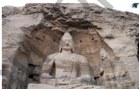
Ил. 10. Пещера Могао.

«Дуньхуан» – произведение, пронизанное мотивом «шелкового пути». В нем город Дуньхуан является декорациями, пещера Могао становится осязаемой. Посредством формы народной симфонической картины раскрывается прекрасная, богатая культура города Дуньхуан и его духовный облик. Музыка симфонической картины основывается на фактических материалах о «шелковом пути», а также на сохранившихся материалах традиционной народной музыки и древних нотных записях. Автор также использовал характерное для Дуньхуана арочное зодчество, и, придерживаясь принципа «приближать сопоставление, отдалять отклик», разработал музыкальную конфигурацию произведения, в которой каждая пьеса по силе, тембру, настроению представлена в сопоставлении, обладает своими средствами выразительности. Каждая часть целостна, одновременно демонстрирует древнюю историю Дуньхуана и подробно раскрывает блестящую эпоху процветания через путешествие во времени.