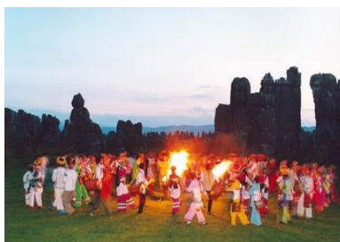
Ил. 2. Танец народности Саньи.

Третья часть «Танец народности Саньи» – это яркая реалистичная картина, изображающая народные песни и пляски, музыка от начала до конца звучит в пылкой манере, ярко и красочно, раскрывая сцены радостных песен и плясок народности Саньи.