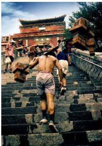
Ил. 8. Песня носильщиков.

(унисон) «Рев пучины водопада», ударные инструменты «Песня носильщиков», щипковые инструменты «Небесный Тракт ступает по дождю», ансамбль «Похвала камню, отвращающему зло», ансамбль «Вершина Дай любит красота», симфонический хор «Взаимодействие неба и земли». Музыкальное произведение соединяет в себе хоровое пение, танец, балет, хореографию, декламацию, костюмы и другие виды искусства, которые в значительной степени усиливают выразительность и увлекательность произведения. Посредством грандиозной энергии создается разносторонний, выразительный и необычный облик высокой горы Тайшань. С помощью абсолютно новых форм исполнения национальной музыки и творческих идей отражается многовековая история, глубокая культура, предания и легенды Тайшань. Благодаря пестрому колориту и утонченному стилю в симфонии ярко выражены великие моральные убеждения и идеалы священной горы [3].