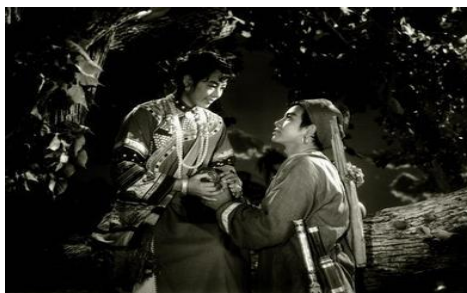
Ил. 3. Серенада под луной.

Четвертая часть «Серенада под луной» – это картина любовной серенады в светлых тонах. Она говорит нам о схожести лирической поэзии и живописи разных народностей. Идея, которую вкладывает автор в эту пьесу, – это то, что он реально видел и слышал во время вечерних прогулок под луной.