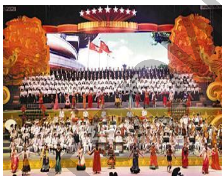
Ил. 6. Выступление симфонической картины «Гора Тайшань».