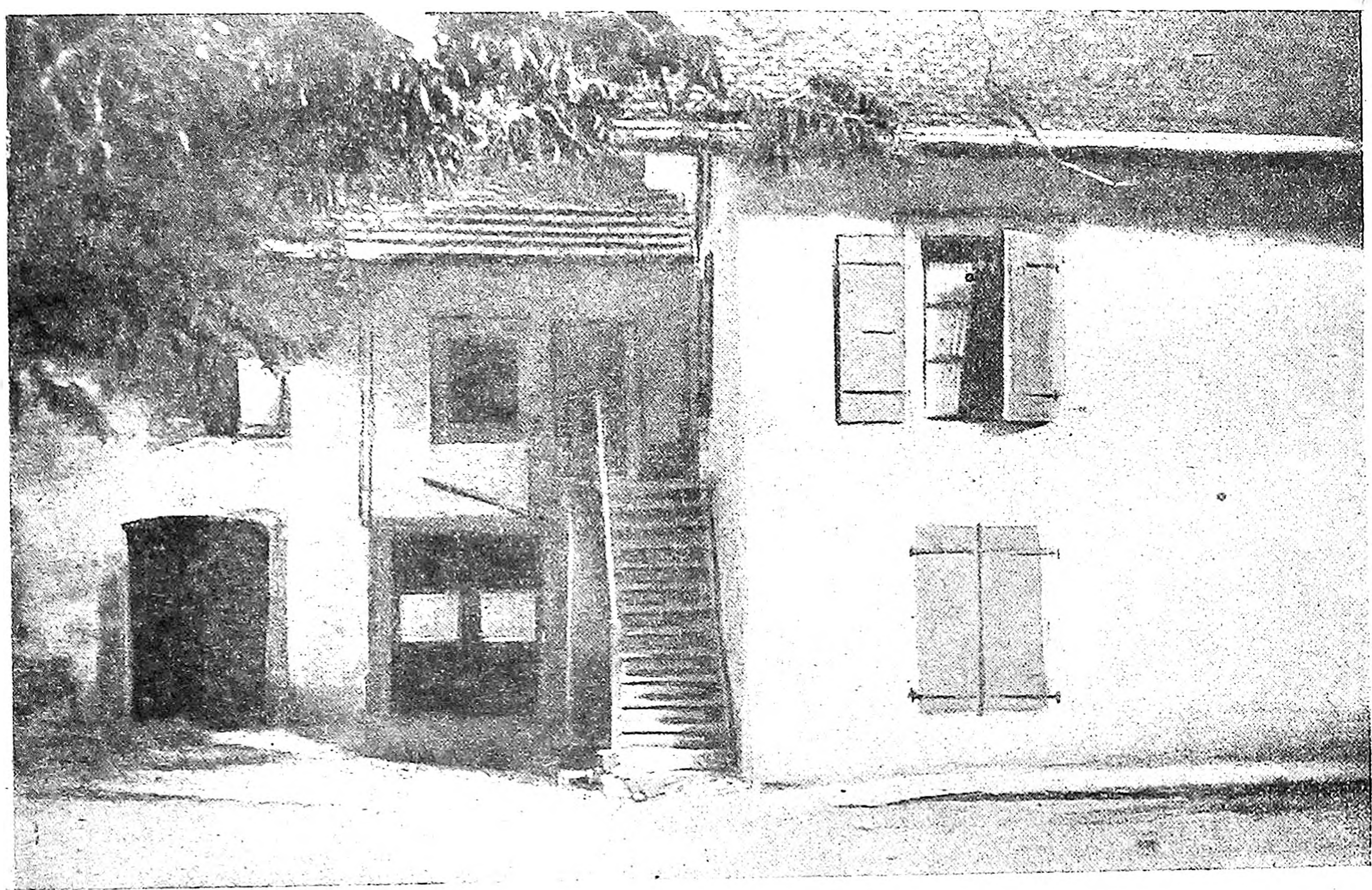
Домик в Морне, где жили изгнанные из Швейцарии Г. В. Плеханов и В. И. Засулич с 1892 по 1894 гг.