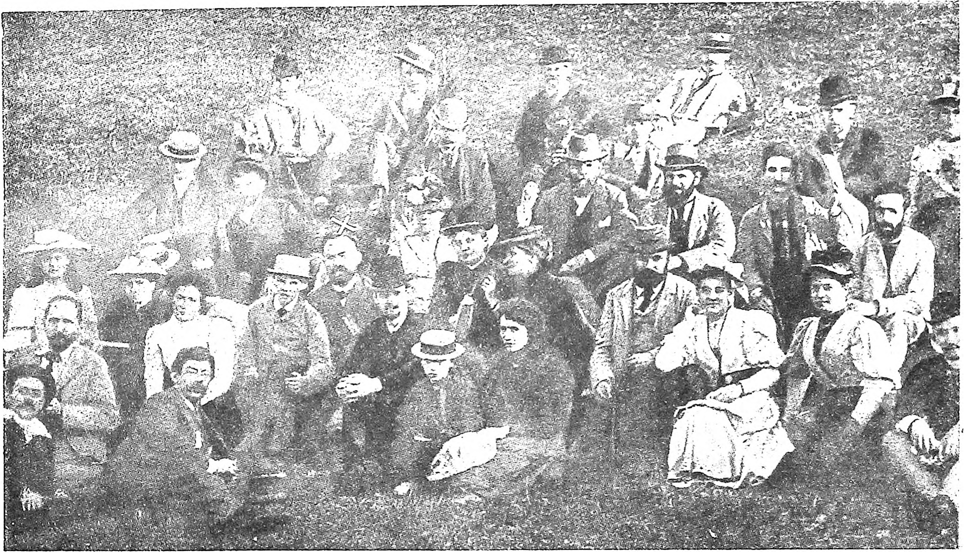
Группа участников международного Цюрихского конгресса 1893 г (X — Г. В. Плеханов)