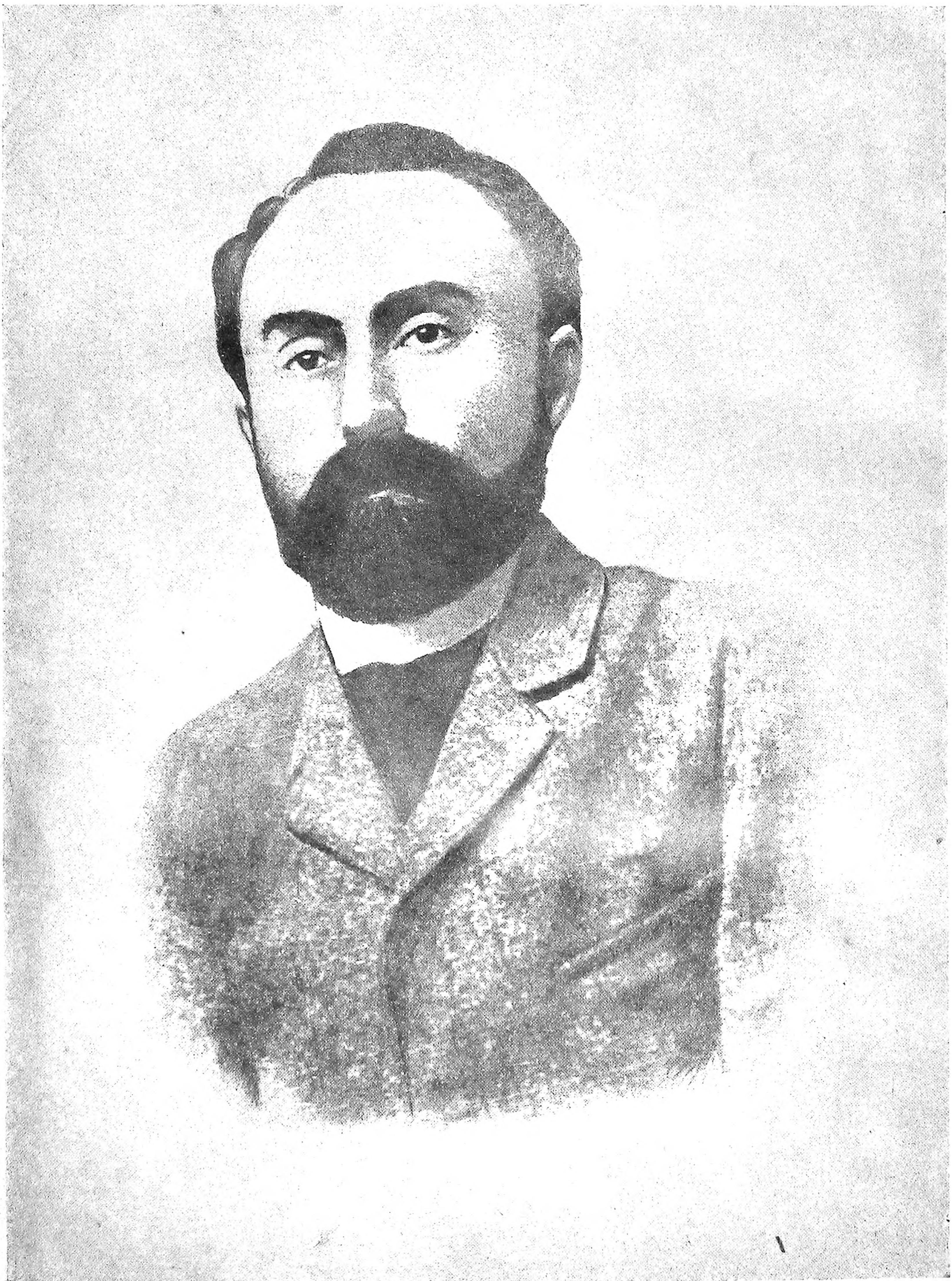
Г. В. Плеханов Фотография начала 1890-х гг.