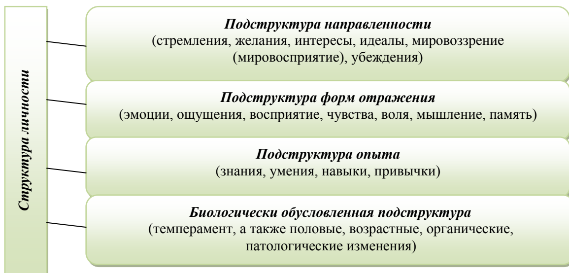
Рис. 1. Структура личности (по К. Платонову).

Культуру межличностного взаимодействия мы понимаем как составляющую общей культуры личности и как сформированное интегральное образование личности, которое характеризуется системой индивидуальных свойств, обеспечивает сознательное гармоничное сочетание ее духовного мира с внешней социальной средой и способствует успешной коммуникации в коллективной деятельности на основе сформированных знаний и умений теории общения.