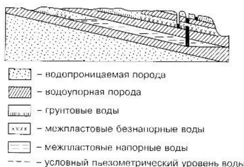
Рис. 1. Схема соотношения различных типов подземных вод [1].

Схема соотношения различных типов пород представлена на рис. 1.