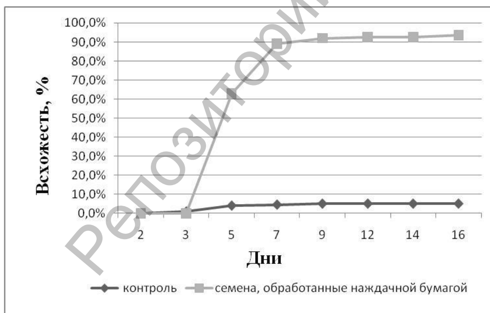
Рис. 1. Всхожесть семян галеги восточной (%) на фильтровальной бумаге и обработанных наждачной бумагой.

Известно, что наждачная бумага достаточно хорошо разрушает покровы семян. Поэтому изучали ее влияние на всхожесть семян галеги восточной. Нами установлено, что именно этот способ обработки дает наибольший процент всхожести семян (93,5%) и является наиболее эффективным по сравнению с другими (действие конц. H_2SO_4 , ошпаривание кипятком) (рис. 1).