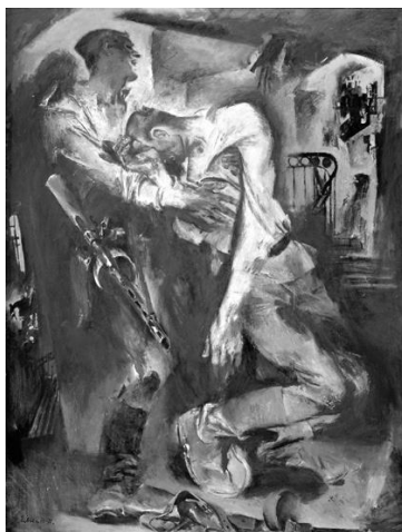
Рисунок 5 – Евсей Моисеенко, «Победа», 1971 г.

«Победа» – одно из самых глубоких произведений Моисеенко, созданию которого автор посвятил два года. М.Ю. Герман увидел в картине «резкий контраст холодного света и глухих теней, а также составные части сложного ассоциативного образа трагичных представлений о войне» (рис. 5).