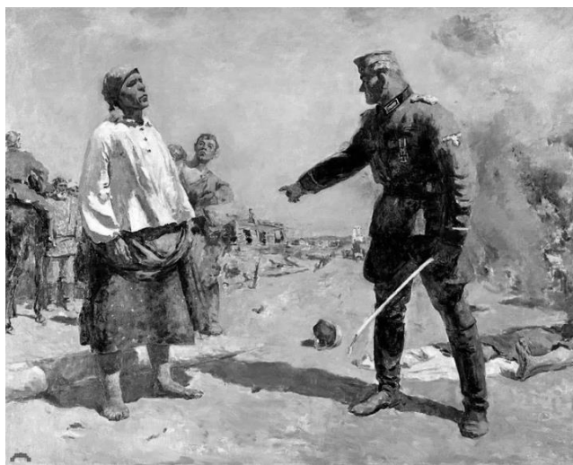
Рисунок 2 – Сергей Герасимов. «Мать партизана», 1950 г.

Позади женщины – пожар, разбомбленная хата, раненные и даже убитые жители деревни. Художник не прорисовывает детально фон картины: он нужен для создания атмосферы всеобщего разорения и бедствия, которые своей сильной спиной как бы закрывает мать партизана. Немец, показанный зрителю вполоборота, лишен ярких индивидуальных черт, и только низкий лоб и выступающая челюсть придает ему звериный облик (рис. 2).