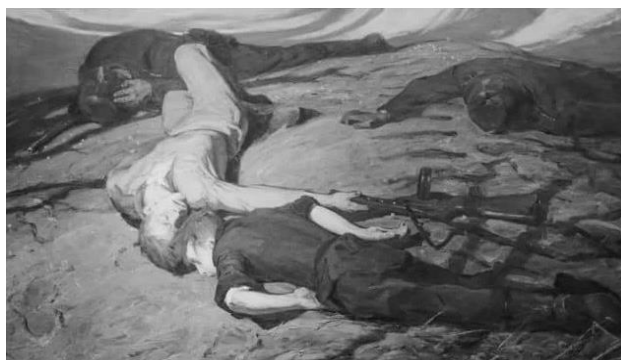
Рисунок 4 – Борис Неменский, «Безымянная высота», 1960 г.

5. Евсей Евсеевич Моисеенко родился в 1916 году в деревне Уваровичи, в Гомельской области. И в его памяти хранились живые воспоминания о войне, которые он мастерски передавал на своих полотнах. В 1941 году он ушёл добровольцем в народное ополчение. На подступах к Ленинграду вместе со своей частью попал в окружение и фашистский плен. До апреля 1945 года находился в концентрационном лагере в Альтенграбове. Когда узники были освобождены союзными войсками, его переправили на родину. Войну закончил, сражаясь в 3-м гвардейском кавалерийском корпусе.