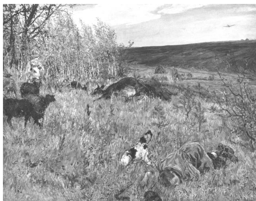
Рисунок 1 – Аркадий Пластов. «Фашист пролетел», 1942 г.

2. Сергей Герасимов знал о войне не понаслышке. В 1915 году был мобилизован в армию и до 1917 года находился на фронтах Первой мировой войны. Как нестроевой солдат служил в санитарном поезде на южном (галицийском) фронте. Герасимов работал над картиной «Мать партизана» на протяжении семи лет, начав в переломный для страны 1943 год. Он передал свои личные сбережения, 50 000 рублей, в Фонд обороны. Он – один из первых носителей почётного звания «Народный художник СССР», учреждённого 26 июля 1943 года.