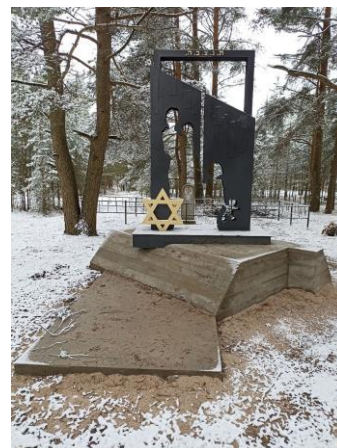
Рисунок 2 – Памятник евреям, погибшим в еврейском гетто в Сураже