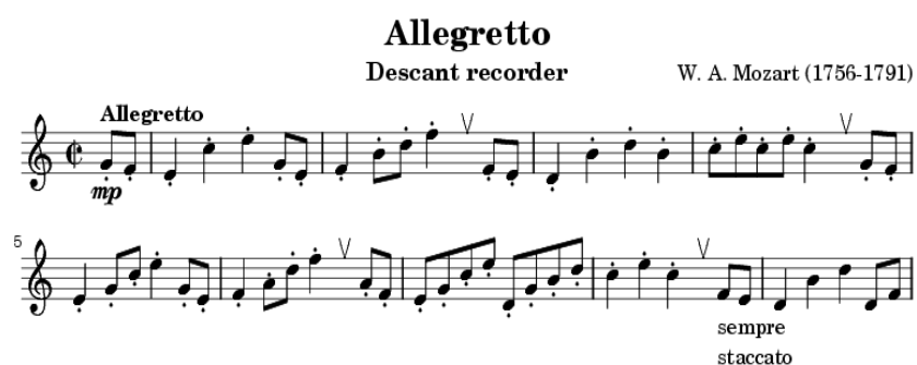
Рисунок 3 – Мелодия из оперы «Волшебная флейта» В.А. Моцарта

В «Волшебной флейте» Моцарт объединил различные музыкальные формы и приемы драматического выражения, уникальные для европейских стран, включая Германию, Австрию, Италию, Францию и Чехию до XVIII века, что сделало всю оперу богатой по содержанию. Можно сказать, что это кульминация немецкой певческой драмы (зингшпиля). В Вене того времени итальянский оперный стиль и немецкий и австрийский народный стиль были хорошо едины: в нем сочеталась строгость драматургии и гибкость комедии. В этой опере мы также можем увидеть представленные Моцартом концепции равновесия и противостояния: принц Тамино представляет сторону добра и истины, тогда как птицелов Папагено слеп, и другая сторона, преследующая материальный комфорт, использует его и священник Зарастро; благородные чувства, чтобы повлиять на месть Царицы Ночи (Königin der Nacht). Моцарт удачно выразил свои мысли в этой сказочной теме (рисунок 3).