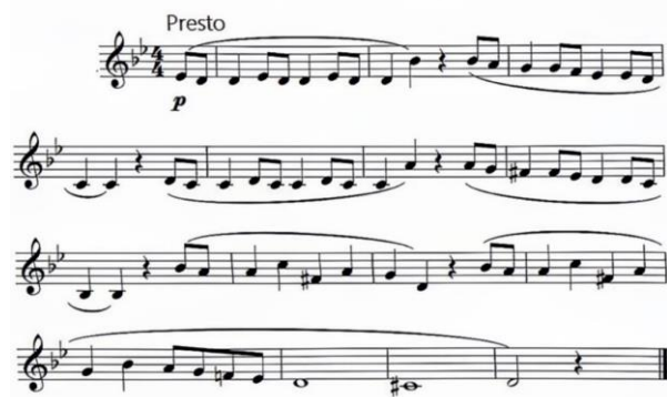
Рисунок 1 – Наиболее известная тема Симфонии № 40 В.А. Моцарта

«Турецкий марш» – третья часть «Фортепианной сонаты ля мажор» Моцарта, ля минор, в размере 2/4. Это типичная форма рондо. Прежде всего, появляется знаменитая тема в тональности ля минор, которая является самой популярной темой во всем произведении. Это экзотическое движение завершается чрезвычайно великолепной и теплой атмосферой. Произведение часто исполняется отдельно и адаптируется под оркестровую легкую музыку. Произведение легко узнаваемо по первым нотам мелодии (рисунок 2):