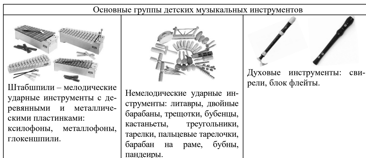
Таблица 1 – Основные группы детских музыкальных инструментов Карла Орфа

Для исполнения элементарной музыки необходимы инструменты, обладающие не только приятным звучанием, но и лёгкостью в освоении. В ансамбле К. Орфа представлены несколько их групп (см. Таблицу 1).