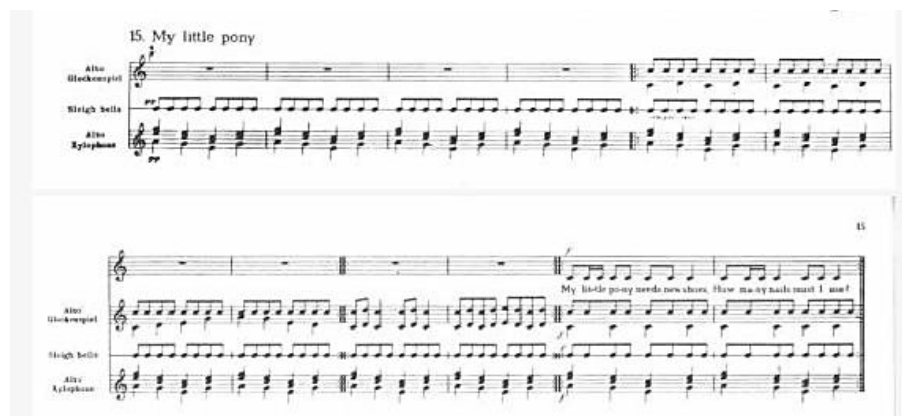
Рисунок 2 – Ноты пьесы «Мой маленький пони»

использует повторяющийся ритм на гlockеншпиле и ксилофоне, имитирующий ритмическое цоканье копыт и бубенцы для передачи легких бодрых шагов. Другие композиции имитируют пение птиц, передают характер различных животных, делая музыку более наглядной и понятной для детей.