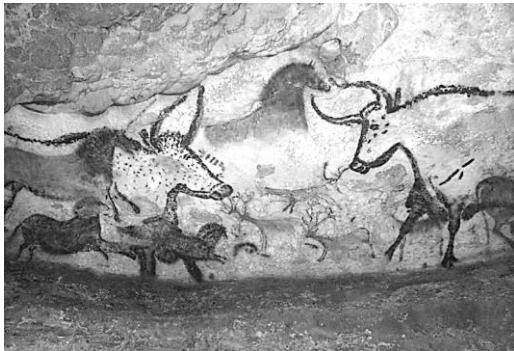
Рисунок 1 – Наскальные изображения в пещере Ласко (Франция)

В Древнем Египте искусство было тесно связано с религией, огромное значение имел заупокойный культ и культ фараона. Именно художники создавали храмы и изображения богов, строили гробницы для захоронений, создавали росписи и рельефы. Египтяне верили, что гробницы и изображения в них необходимы для безопасного перехода души усопшего в загробный мир и для помощи в жизни после смерти. Помимо прочего работы художников помогали укрепить власть и легитимность фараонов, указывали на их божественное происхождение, увековечивали их военные достижения и заслуги.