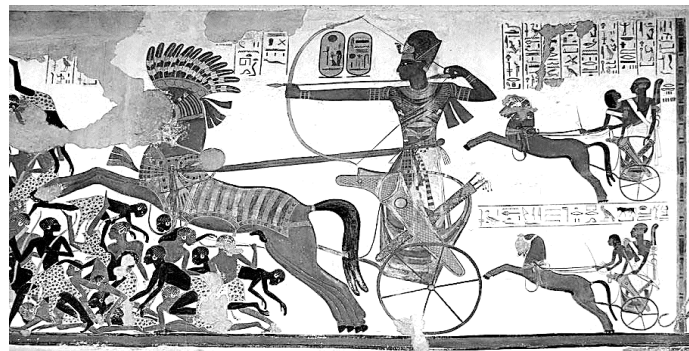
Рисунок 2 – Фреска «Битва при Кадеше». Храм Абу-Симбел (Египет)

В античности, как и в других периодах, искусство часто было связано с религией. Художники создавали статуи богов, храмы и рельефы, которые использовались в культовых практиках и ритуалах.