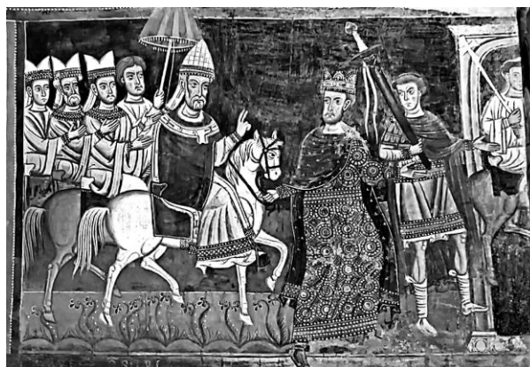
Рисунок 4 – Фреска «Торжественный въезд Сильвестра в Рим». Капелла Сан-Сильвестро (Рим, Италия)

Помимо прочего искусство использовалось для демонстрации власти и статуса. Феодалы и короли заказывали портреты и памятники, чтобы подчеркнуть свою значимость и легитимность. Это также касалось создания гербов и символов, которые отражали принадлежность к определенному роду или территории.