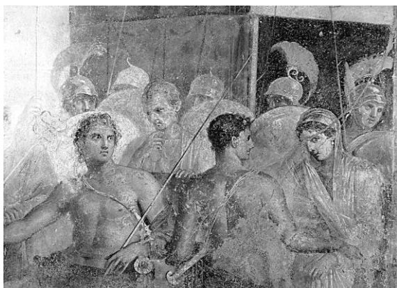
Рисунок 3 – Фреска «Ахилл и Брисеида» (Помпеи, Италия)