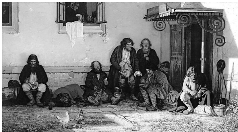
Рисунок 6 – «Земство обедает» Г. Мясоедов (1872 г.)

Вдобавок искусство помогало осмыслить такие изменения, как урбанизация, индустриализация, трансформация классовой структуры общества.