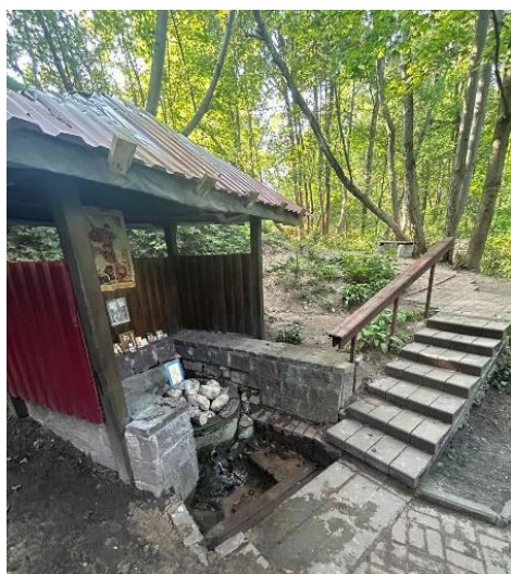
Рис. 1. Родник Георгия Победоносца

Родник святой Параскевы Пятницы (рис. 2) также известен с языческих времён и его почитание связано с языческой богиней Мокаш, которая была связана с водными стихиями и криницами-родниками. В христианские времена родник был назван в честь святой великомученицы Параскевы Пятницы, которая у православных христиан считается целительницей душевных и телесных недугов, хранительницей семейного благополучия.