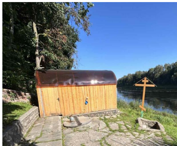
Рис. 4. Родник св. Серафима Саровского

Название 5-го родника (рис. 6) связано с названием деревни Улановичи, которая в середине 20 века вошла в состав г. Витебска [7; с. 455-457].