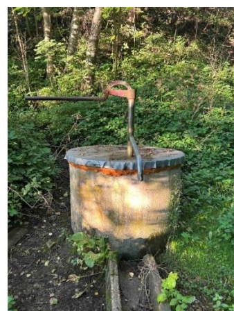
Рис. 6. Родник Улановичи: между прудами