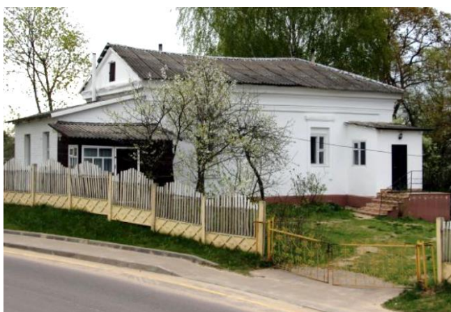
Рис. 5. Здание бывшего храма Воздвижения Креста Господня

Название 5-го родника (рис. 6) связано с названием деревни Улановичи, которая в середине 20 века вошла в состав г. Витебска [7; с. 455-457].