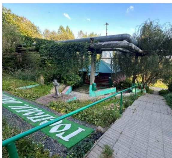
Рис. 2. Родник Параскевы Пятницы

Родник Иоанна Крестителя (рис. 3) находится в 60 метрах к югу от левого берега реки Витьба, в глубоком овраге. Назван в честь святого, являющегося после Богородицы самым почитаемым христианским святым.