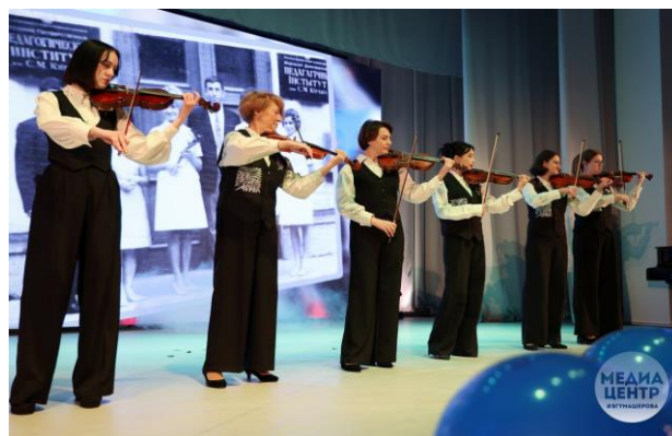
Рисунок 2 – Актный зал ВГУ имени П.М. Машерова

На сцене Дворца Республики ансамбль скрипачей выполнял функцию аккомпанирующей группы. Согласно сценарию проведения мероприятия постановка номера по видению режиссера была связана с передвижением участников ансамбля скрипачей по сцене в связи с появлением солиста во второй части концертного номера. Таким образом, вопрос стоял не о звуковых возможностях коллектива, а о его сценическом движении: за ограниченный временной период необходимо было переместиться с расположения участников из линии в полукруг (Рисунок 3).