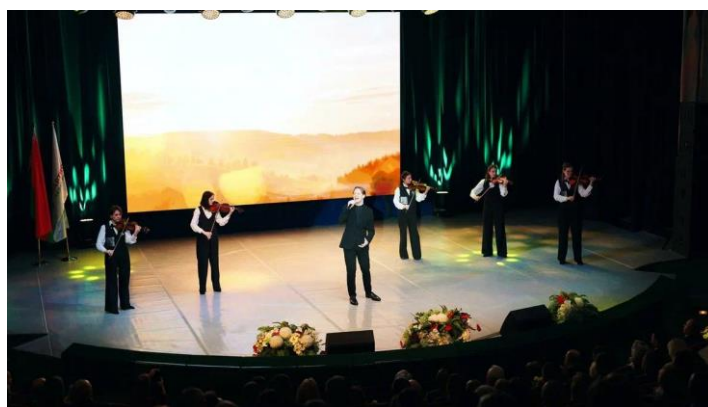
Рисунок 3 – Дворец Республики, г. Минск

На сцене Дворца Республики ансамбль скрипачей выполнял функцию аккомпанирующей группы. Согласно сценарию проведения мероприятия постановка номера по видению режиссера была связана с передвижением участников ансамбля скрипачей по сцене в связи с появлением солиста во второй части концертного номера. Таким образом, вопрос стоял не о звуковых возможностях коллектива, а о его сценическом движении: за ограниченный временной период необходимо было переместиться с расположения участников из линии в полукруг (Рисунок 3).