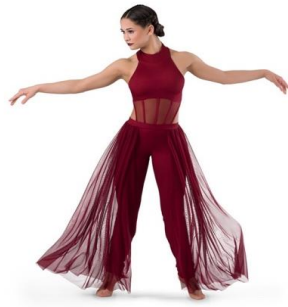
Рисунок 1 – Сценический костюм как элемент визуального образа хореографического шоу

Этот эффектный бордовый костюм для шоу в стиле контемпорари (характерный для постановок уровня World of Dance) создает образ «земной грации», виртуозно сочетая атлетическую мощь с воздушной легкостью летящих шлейфов.