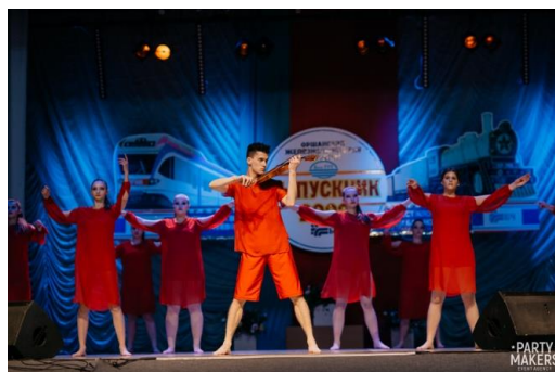
Рисунок 4 – Концерт ансамбля эстрадного танца «Inspiration»

Сопоставление международного и локального опыта позволяет выделить ключевые закономерности успешного хореографического проекта: наличие концептуальной идеи, ее последовательную реализацию и профессиональную организацию процесса. Таким образом, проектирование танцевального шоу выступает эффективной формой художественной и педагогической деятельности (Рисунок 4).