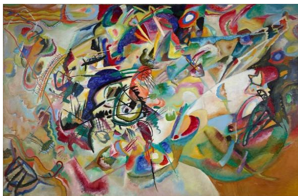
Рисунок 1 – В.В. Кандинский «Композиция VII»

Картина «Композиция VII» (1913) считается одним из наиболее значимых произведений художника и своеобразной кульминацией его раннего абстрактного периода. Работа отличается сложной многослойной структурой, насыщенной динамикой и интенсивным цветовым звучанием. Предметные мотивы здесь практически утрачивают узнаваемость и преобразуются в систему цветовых и линейных ритмов. В каталоге Государственной Третьяковской галереи подчеркивается, что произведение представляет собой «синтез цветовых и линейных элементов, направленных на выражение духовного напряжения» (Рисунок 1) [2, с. 84].