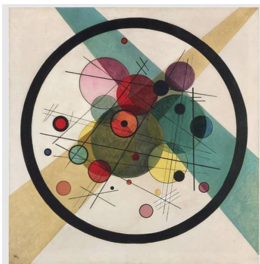
Рисунок 3 – В.В. Кандинский «Круги в круге»

Картина «Круги в круге» (1923), созданная в период преподавания художника в Баухаусе, демонстрирует его интерес к геометрической организации композиции. Использование круга как основного формообразующего элемента позволяет выстроить уравновешенное пространство, подчиненное строгой внутренней логике. Данное произведение отражает синтез художественной и теоретической работы Кандинского (Рисунок 3)