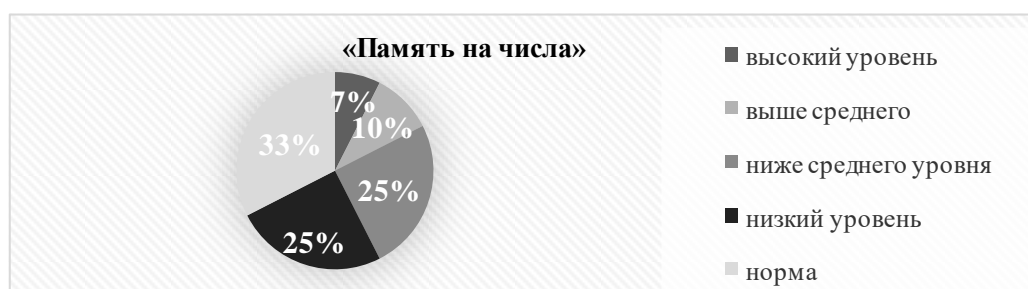
Рисунок 2 – Результаты методики по определению объёма и точности кратковременной зрительной памяти

По результатам проведенного исследования по методике «Память на числа» (рисунок 2) можно сделать вывод, что большинство испытуемых (13 человек или 33%) демонстрируют результаты, которые можно охарактеризовать как норму. Данная группа показала результат, считающийся соответствующим средним значениям методики. Наиболее распространенными ошибками были добавления лишних цифр и повторение уже названных. Это может говорить о излишней тревоге при прохождении методик или нарушениях концентрации внимания, однако это также может быть случайной ошибкой, связанной с невнимательностью.