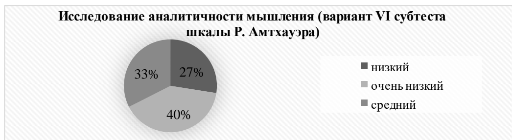
Рисунок 3 – Результаты методики по определению уровня развития аналитичности индуктивного мышления

Анализируя результаты исследования аналитичности мышления (вариант VI субтеста шкалы Р. Амтхауэра), можно сделать вывод, что в данной выборке имеется преобладание сниженных показателей (рисунок 3). Большинство испытуемых (67%) демонстрируют низкий или очень низкий уровень аналитичности мышления, что может быть связано с возрастными когнитивными изменениями, такими как замедление скорости обработки информации, снижение гибкости мышления или другими причинами. Очень высокий или высокий уровень не был представлен в рамках данной выборки.