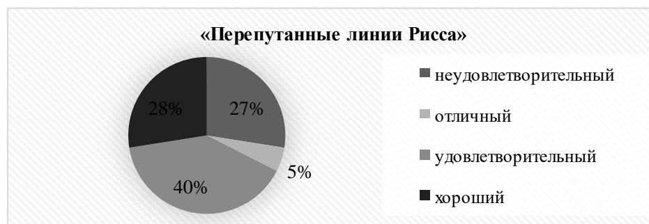
Рисунок 4 – Результаты методики по оценке концентрации внимания, зрительно-моторной координации и когнитивной гибкости

При анализе результатов исследования по методике «Перепутанные линии», можно сделать вывод, что большинство испытуемых (40%) справились с заданием на приемлемом уровне (рисунок 4), что говорит о сохранности базовых функций внимания и зрительного восприятия у значительной части пожилых людей. Однако темп заполнения ячеек был достаточно низким, а также наблюдалось большое количество ошибок. В отдельных случаях участники испытывали большие трудности в поиске правильного пути (в частности, подобные затруднения были вызваны слабым зрением и тремором рук испытуемых), что также влияло на количество времени, затраченного на выполнение задания и снижало уровень мотивации и уверенности в собственных силах.