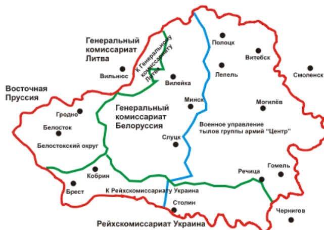
Рис. 2. Военно-административное деление оккупированной территории Беларуси.