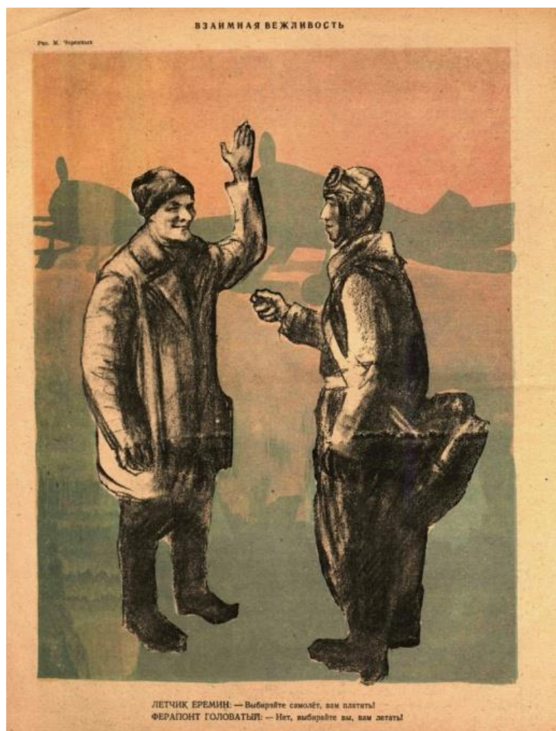
Рисунок 1. – Взаимная вежливость (М. Черемных) [8]

Волгограда [6]. Это событие запечатлел М. Черемных на рисунке «Взаимная вежливость» в выпуске №21-22 1944 года (рисунок 1).