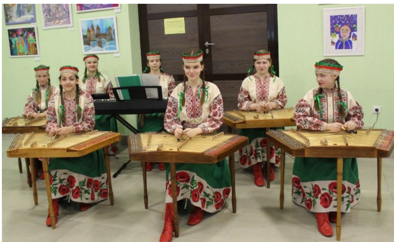
Рисунок 5 — Ансамбль Образцового цимбального оркестра

композитор Юрий Владимирович Семеняко (рис. 4). Он являлся председателем жюри по присвоению звания «образцовый» цимбальному оркестру Витебского областного Дворца детей и молодежи. Каждые три года цимбальный оркестр подтверждает это почетное звание. И вы знаете это не понаслышке — многие из вас являются участниками этого коллектива.