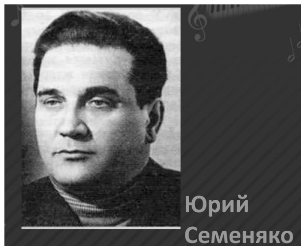
Рисунок 4 — Ю.В. Семеняко