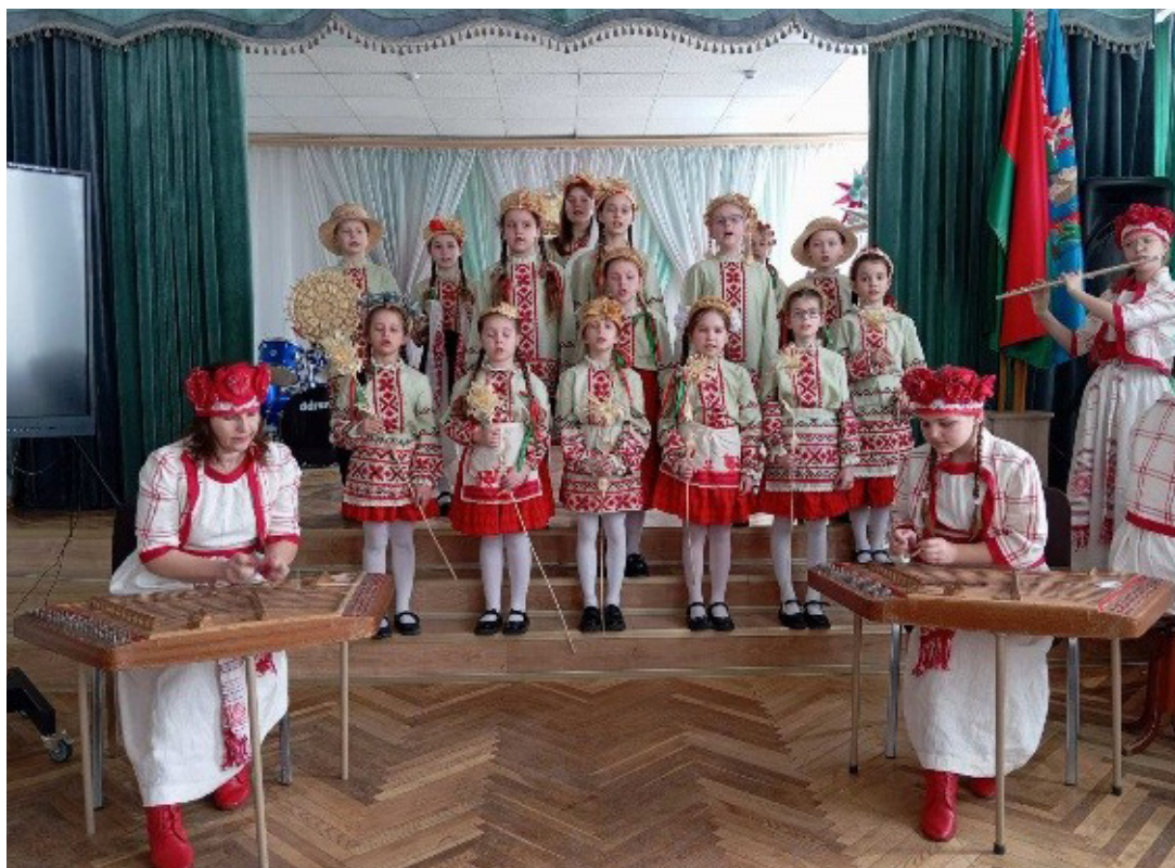
Рисунок 10 — Фотография на память. Исполнение песни «Радзіма мая дарагая»

«Радзіма мая дарагая» (рис. 10). И пусть эта песня будет вашим компасом в школьной жизни!