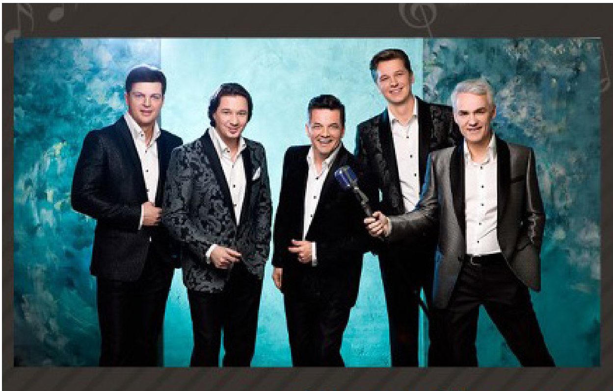
Рисунок 9 — Вокальный ансамбль «Чистый Голос»

Она стала настолько популярной, что многие были уверены, что эта песня звучала во время войны. Самое интересное, что «Лесная песня» была включена как народная в антологию белорусской народной песни Цитовича. Действительно, песенному творчеству Оловникова присуща народная интонация, распевность, фольклорный специфический мелос [3].