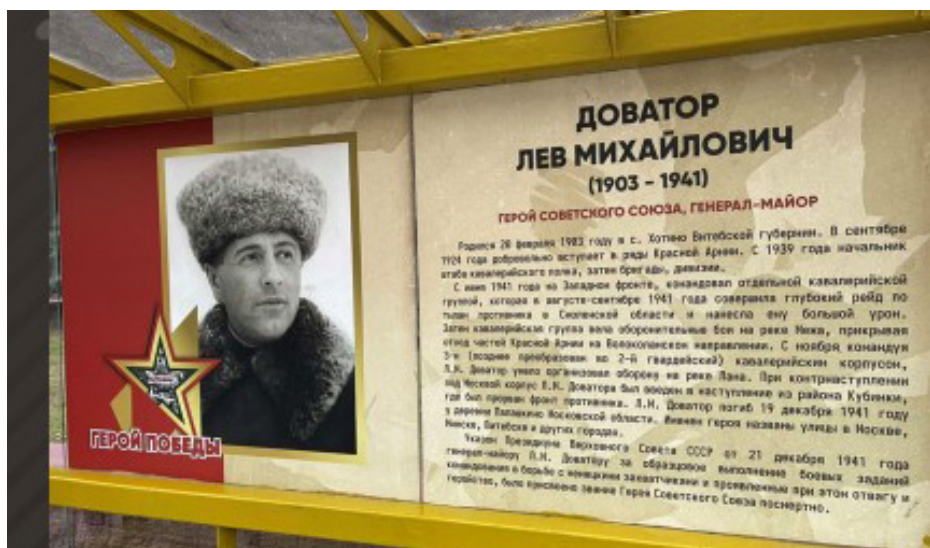
Рисунок 6 — Троллейбусная остановка «Улица Доватора» в г. Витебске