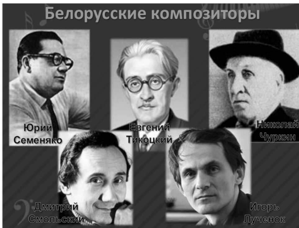
Рисунок 3 — Белорусские композиторы

ственной консерватории (ныне — Белорусская академия музыки). Владимир много слушал музыку, охотно посещал концерты.