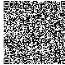
Рисунок 7 — QR-код видеоконтента «Песня о Доваторе»

Учитель. Что ж, настало время не только услащать эту песню, но и увидеть казаков. Хорошего просмотра! (рис. 7)