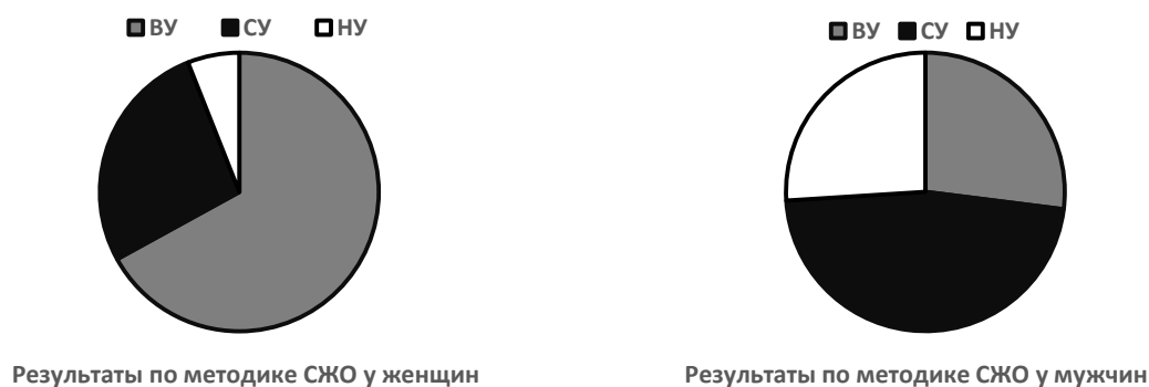
Рисунок 1 – Результаты теста «Смыслжизненные ориентации» Д.А. Леонтьева

Охарактеризуем результаты по Шкале удовлетворённости жизнью SWLS Э. Динера. Так, в ЭГ1 выявлен высокий уровень у 11 женщин (73%). Для них характерны: чувство реализованности и гармонии, согласованность жизненных событий с ожиданиями, удовлетворённость социальными и профессиональными достижениями, эмоциональная стабильность и оптимизм. При среднем уровне (3 женщины, 20%) наблюдается: частичная удовлетворённость жизнью, наличие сфер, вызывающих сомнения (отношения, карьера, самореализация), стремление улучшить определённые аспекты своей жизни. Низкий уровень демонстрирует 1 женщина (7%), для которой характерны: неудовлетворённость качеством жизни, переживание эмоциональной истощённости, чувство несоответствия между желаемым и достигнутым, возможные проявления фрустрации и снижения самооценки.