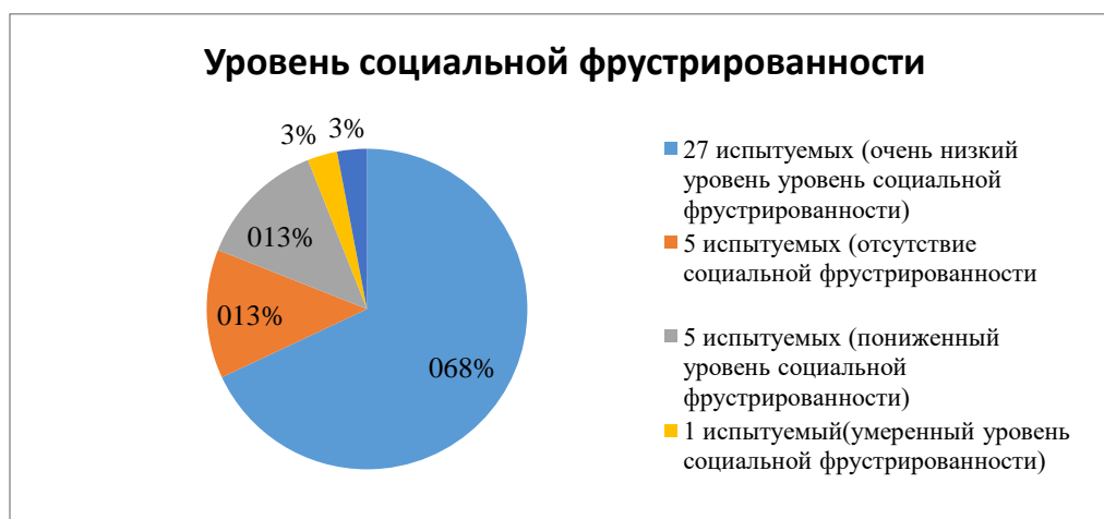
Рисунок 2 – Результаты по методике диагностики уровня социальной фрустрированности Л.И. Вассермана (модификация В.В. Бойко)

1 испытуемый (3%), имеет повышенный уровень социальной фрустрированности: испытывает сильное психическое напряжение из-за неудовлетворенности своими социальными достижениями и положением в обществе (рисунок 2).