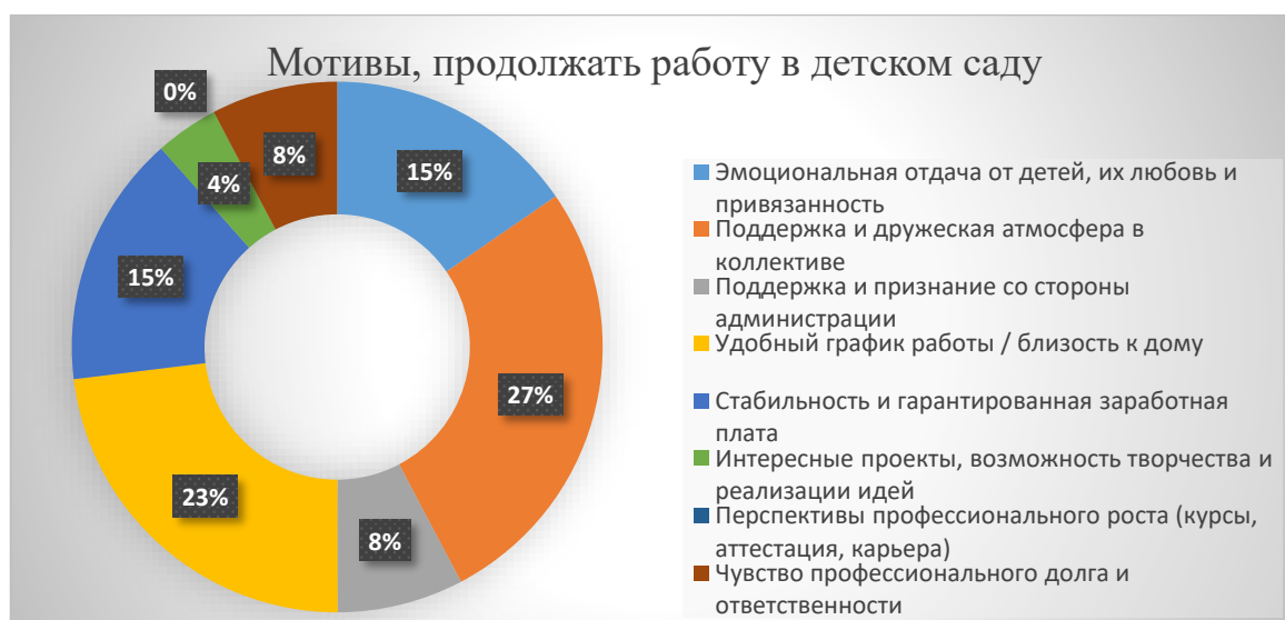
Рисунок 2 – Что для Вас является главным мотивом, чтобы продолжать работу в детском саду именно сейчас?