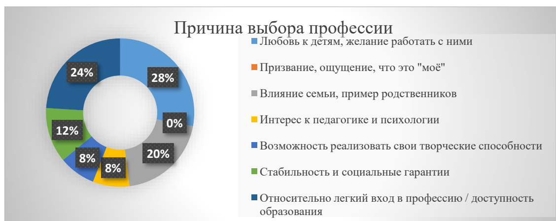
Рисунок 1 – Что стало для Вас основной причиной выбора профессии педагога дошкольного образования?

Результаты и их обсуждение. При обработке анкеты получили следующие результаты: