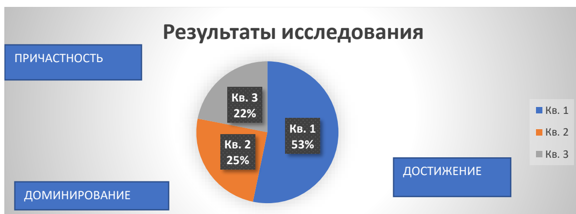
Рисунок 2 – Результаты изучения потребностей, как основы мотивации студентов

Результаты исследования, прошедшего в учебных группах, показывают, что общей закономерностью, которая прослеживается у всех групп респондентов, является наличие ярко выраженных потребностей в достижении успеха (198 респондентов, 53% от общей выборки), которые проявляются в стремлении к достижению поставленных целей, умении их ставить и брать на себя ответственность за их осуществление. Не менее важное место занимает и потребность в доминировании (92 респондента, 24,7%), проявляющаяся как стремление контролировать ход событий и воздействовать на других людей. Удовлетворение данной потребности особенно значимо для тех студентов, которые занимаются или занимались индивидуальными видами спорта. Потребность в причастности (81 респондентов, 21,8% от общей выборки), которая проявляется в стремлении человека к любви, привязанности, дружеским отношениям с окружающими. Данная потребность более значима для группы респондентов, занимающихся групповыми видами спорта. Результаты количественной обработки данных по тесту «Что вами движет» представлены в рисунке 2.