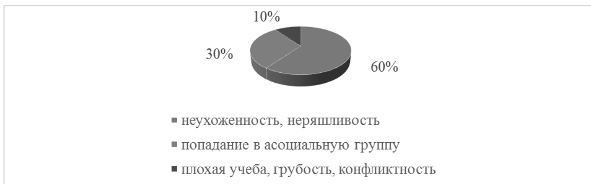
Рисунок 3 – Признаки, по которым можно определить дезадаптированных обучающихся

Большинство опрошенных педагогов (90%) придерживаются мнения о том, что авторитарный либо попустительский стиль воспитания может служить причиной дезадаптации обучающихся. При этом педагоги уверены, что ни наличие лишь одного родителя в семье, ни многодетность семьи не являются основными причинами социальной дезадаптации. Ведь и единственный родитель способен полноценно обеспечить и воспитать ребенка, и в многодетной семье вполне возможно создать атмосферу любви и взаимопонимания, где каждый ребенок сможет чувствовать себя важным и нужным.