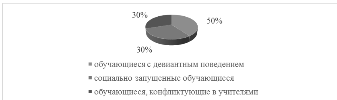
Рисунок 2 – Обучающиеся, имеющие признаки дезадаптации

На вопрос «Каких обучающихся можно отнести к категории дезадаптированных?» 40% опрошенных ответили, что к данной категории можно отнести обучающихся с девиантным поведением, 30% респондентов считают, что социальная дезадаптация присуща социально запущенным обучающимся, еще 30% считают, что дезадаптированные обучающиеся – это те, кто очень часто конфликтует с педагогами (рисунок 2).