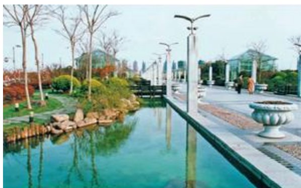
Рисунок 2. «Парк века», г. Шанхай

группы. Хотя в парке сочетаются европейские и азиатские стилистические черты, он все же выдержан в китайском стиле, с обширным центральным водоемом и разнообразной флорой долины реки Янцзы (рис. 3).