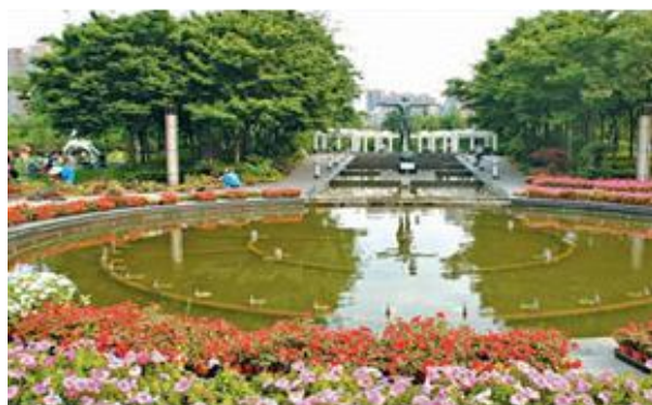
Рисунок 3. Новый городской парк, г. Шанхай

Парк «Хэхуачи» (Лotosовый пруд) был построен ещё в 1990-х гг. на основе водоема, через который проходит один из городских каналов древнего города Янчжоу. Водные поверхности занимают более двух третей всей площади парка. Объект расположен в центре города, непосредственно к берегам примыкают кварталы городской застройки, и он активно используется как место отдыха населения. Парк украшают каменные выгнутые зигзагообразные деревянные мосты, а также традиционные китайские павильоны и беседки с видом на воду, из которых летом можно любоваться цветущим лотосом. Здесь много замощенных площадей для многочисленной публики. Основу насаждений составляют плакучие ивы и тополя, молодые кедры, сосны, саговники в кадках, есть большие заросли бамбука. Много цветущих деревьев и кустарников: сливы, камелии, рододендроны, форзиции [1, с. 30]. Камни из низовий реки Янцзы широко использованы в композициях или как самостоятельная садовая скульптура. Одна из достопримечательностей парка – живущая там большая стая белых голубей, придающих особый колорит всему пространству (рис. 4).