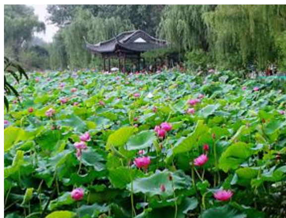
Рисунок 4. Парк «Хэхуачи», г. Янчжоу

Таким образом, садово-парковое искусство – это особый комплекс идейно-художественных концепций, приемов архитектуры, садоводства и т.д. Выделяют раз-