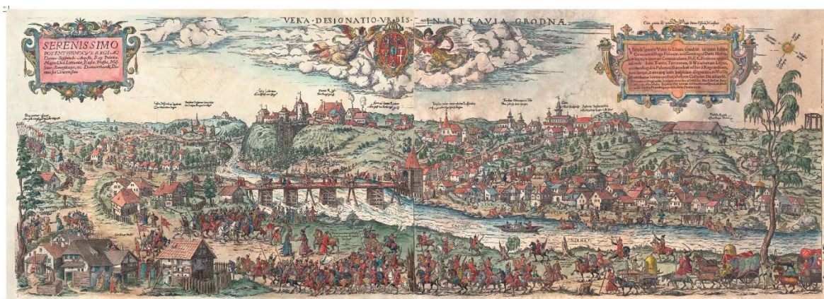
Картографический источник XVI в. – медерит Цюндта-Адельгаузера 1567 г. с изображением г. Гродно

В целом все древнейшие церкви Гродно можно разделить на следующие под- группы: