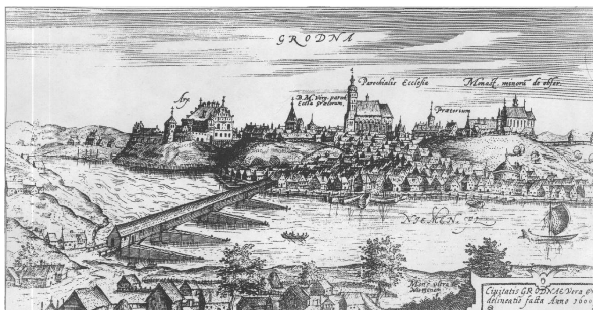
Картографический источник XVII в. – гравюра белорусско-польского картографа Томаша Маковского "Civitatis GRODNAE Vera delenatio ere[cta] facta Anno 1600" с изображением г. Гродно