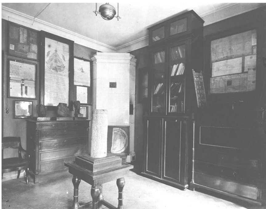
Рис. 6. Музей палеографии Н.П. Лихачева

Лихачева (рис. 6). Музей палеографии по замыслу его владельца должен был соответствовать Лейпцигскому «Музею книги» «...со специальным уклоном в область истории документа и его аутентификации».