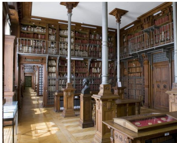
Рис. 2. Сокровищница хартий. Музей Национального архива Франции.

В России первым шагом к музейной демонстрации архивных документов стало создание в 1831 году Румянцевского музея в Петербурге. Его основой стала коллекция графа Н.П. Румянцева, главной страстью которого было собирание рукописных древностей (рис. 3). Центральное место в коллекции графа занимали редкие рукописи, старопечатные книги, инкунабулы и другие памятники письменной культуры. По завещанию Н.П. Румянцева, после его смерти коллекция была передана в дар государству, и стала доступна широкой публике. В залах музея были установлены специальные витрины для экспонирования письменных памятников [2].