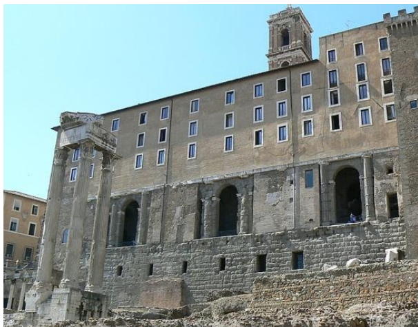
Рис. 1. Табуларий (лат. tabularium ) (цокольная часть восточного фасада Дворца сенаторов), государственный архив в Древнем Риме.

Примером институционализации «культуры архива» стал Музей Национального архива Франции (Musée des Archives nationales), открытый в 1867 году в парижском особняке Субиз. В нем представлены оригиналы королевских указов, папских булл, грамот, автографов исторических деятелей, а также образцы восковых печатей, сундуков и коробок, которые использовались в средние века и новое время для работы с документами. Одна из стен музея спроектирована таким образом, что дает возможность через стекло заглянуть в самое старое архивохранилище Франции Сокровищницу хартий (fr. Trésor des chartes ) (рис. 2).