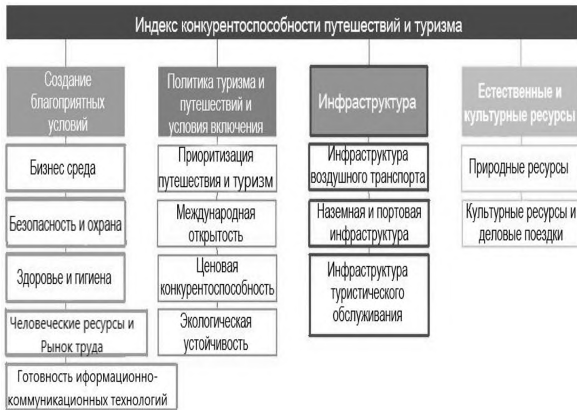
Рисунок 3 – Структура индекса конкурентоспособности туризма и путешествий

В структуре данного индекса выделяются 4 основных субиндекса, которые рассчитываются из группы показателей (рисунок 3).