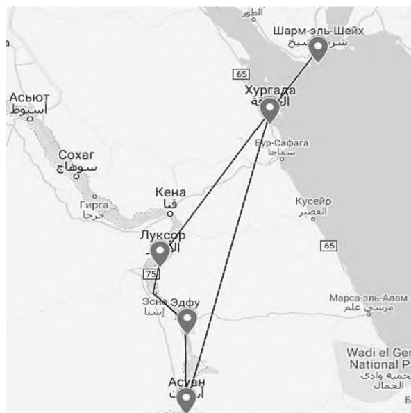
Рисунок 4 – Туристический маршрут по Египту

Туристический маршрут внедрен в ЧТУП «ВитТрэвелКомпани» в г. Витебске для практического использования (акт о внедрении от 7 июня 2019).