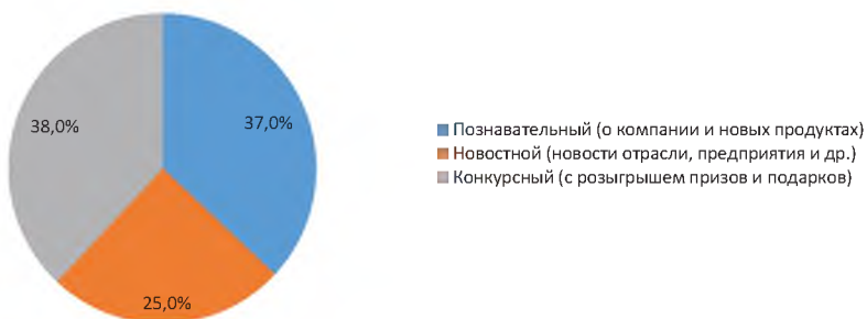
Рисунок 3. Ответ на вопрос:

«Какого направления должен быть корпоративный блоггинг ЗАО «Ваш Ассистанс»