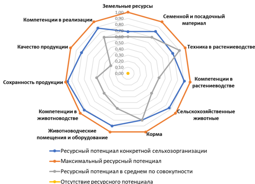
Рисунок 1 – Ресурсный потенциал сельскохозяйственной организации

Примечание. Собственная разработка автора на основании расчетов по предлагаемой методике.