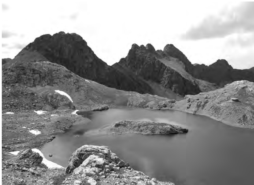
Рис. 11. Местообитание Carabus boeberi glebi ssp. n., Карачаево-Черкесская Республика, хр. Абишира-Ахуба, озеро между перевалами Агур и Мылгвар, 2785–2830 м н.у.м.