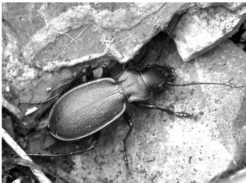
Рис. 10. Carabus boeberi glebi ssp. n. в природе, Карачаево-Черкесская Республика, хр. Абишира-Ахуба, озеро между перевалами Агур и Мылгвар.