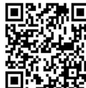
Рисунок 2. QR-код для прохождения упражнений LearningApps

Для поддержки процесса осведомленности с использованием интерактивных модулей (упражнений) был разработан интерактивный модуль (викторина-упражнение), используя готовые шаблоны LearningApps (рис. 2).