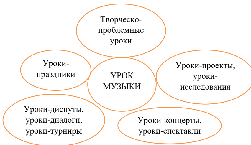
Схема 2. Интеграция различных уроков музыки в начальной школе

Поэтому, одно из условий формирования ценного отношения к музыке в музыкально-творческой деятельности можно выделить взаимодействие и сотворчество обучающегося и педагога в рамках лично-ориентированного обучения, а именно реализация и интеграция различных типов уроков.