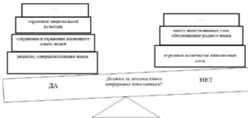
Рисунок 3. Весы аргументации «Должна ли лексика языка непрерывно пополняться?»

Рассмотренные выше и многие другие приемы визуализации учебной информации обладают рядом преимуществ, которые позволяют активно использовать их для решения задач оптимизации процесса обучения русскому языку и усиления его направленности на интеллектуальное развитие