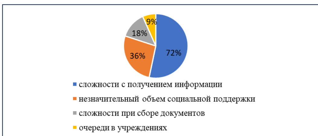
Рисунок 3. – Что Вашей семье затрудняет получение услуг по социальной поддержке?

Также анализ анкетирования показал, что о дополнительных мерах поддержки семей с детьми-инвалидами знают лишь 36% респондентов. 90% опрошенных признались, что хотят узнать информацию о программах и проектах, которые реализуются в нашем регионе, а также об общественных организациях, которые оказывают поддержку семьям с детьми-инвалидами.