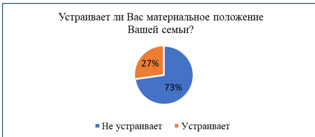
Рисунок 2. – Материальное положение семей