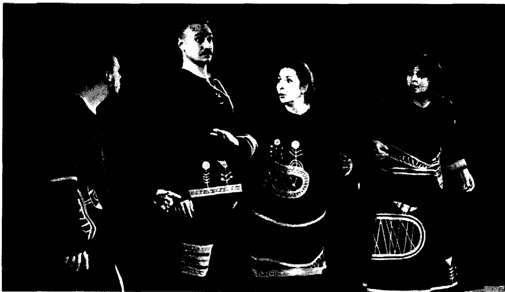
Рисунок 3. Спектакль «Чарамара»

«работать» на сцене и вжиться в роль, она способна изменить внешность и характер игры актёра. Очень часто пластическая форма костюма напоминает куклу.