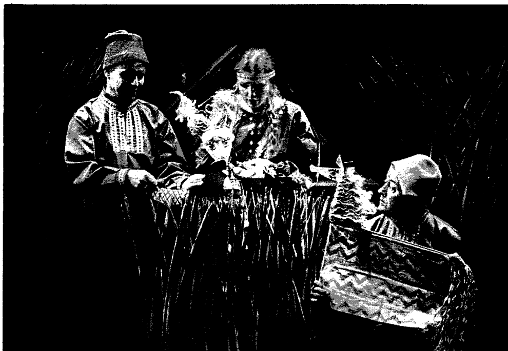
Рисунок 9. Спектакль «Як Аленка ведзьму перамагла»

Витебск) куклы и актёры, одетые в костюмы, рождённые художником, хорошо вписываются в пространство спектакля. При создании театральной одежды автор проявляет фантазию, использует новые материалы и фактуры. Облачение актёров отображает национальные особенности белорусского костюма и понимание народом эстетических идеалов красоты. Автор нарядов взял за основу не конкретный строй этнографического региона, а изучив особенности белорусского народного костюма, разработал свой стилизованный образ для героев этой сказки. В то же время в создании каждого конкретного образа учитывалась принадлежность героев к разным условиям [6, с. 176].