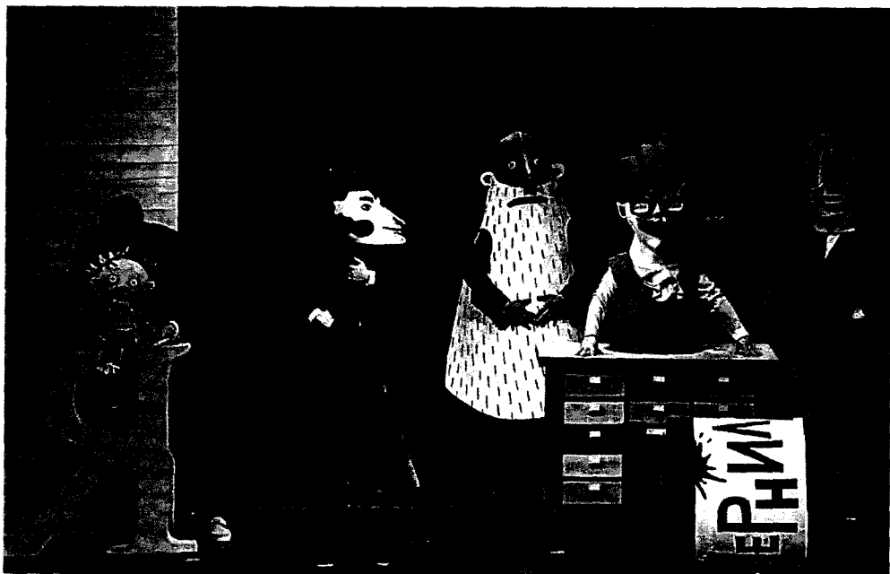
Рисунок 5. Спектакль «В стране невыученных уроков»

Красочные, детализированные костюмы, разработанные художником, создают особую атмосферу волшебства. Яркие краски и оригинальная фактура полностью погружают зрителя в мир животных и помогает поверить в реальность увиденного.