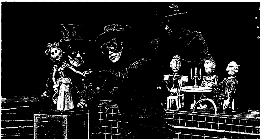
Рисунок 2. Спектакль «Локис»

сценографии. Игровой костюм – это средство преобразования облика актёра и один из элементов его игры. Как одежда действующего лица костюм является зачастую основой и для соединения рассмотренных выше типов (персонажного и игрового). Оба типа решения одежды на практике часто используются одним и тем же художником, причём не только в разных, но и даже в одном спектакле [2].