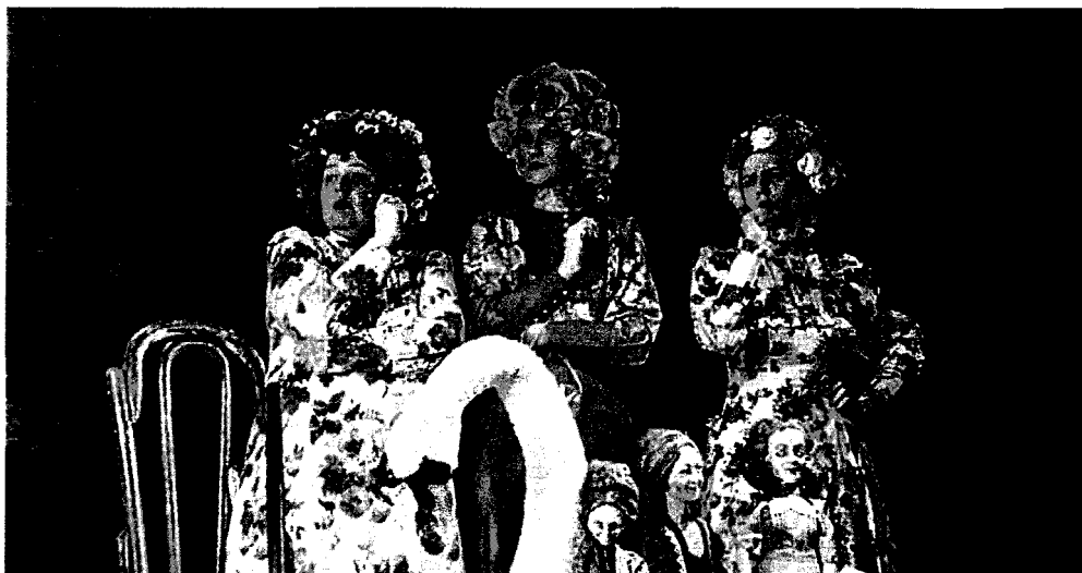
Рисунок 1. Спектакль «Николаша»

характеризует цвет: «Последний штрих в характеристике костюма – это цвет. Цвет – это средство живописного решения организации спектакля. В то же время с цветом у людей всегда связываются определённые представления, цвет ассоциируется с настроением и самочувствием. Отношение к цвету характеризует темперамент, вкус» [1, с. 31].