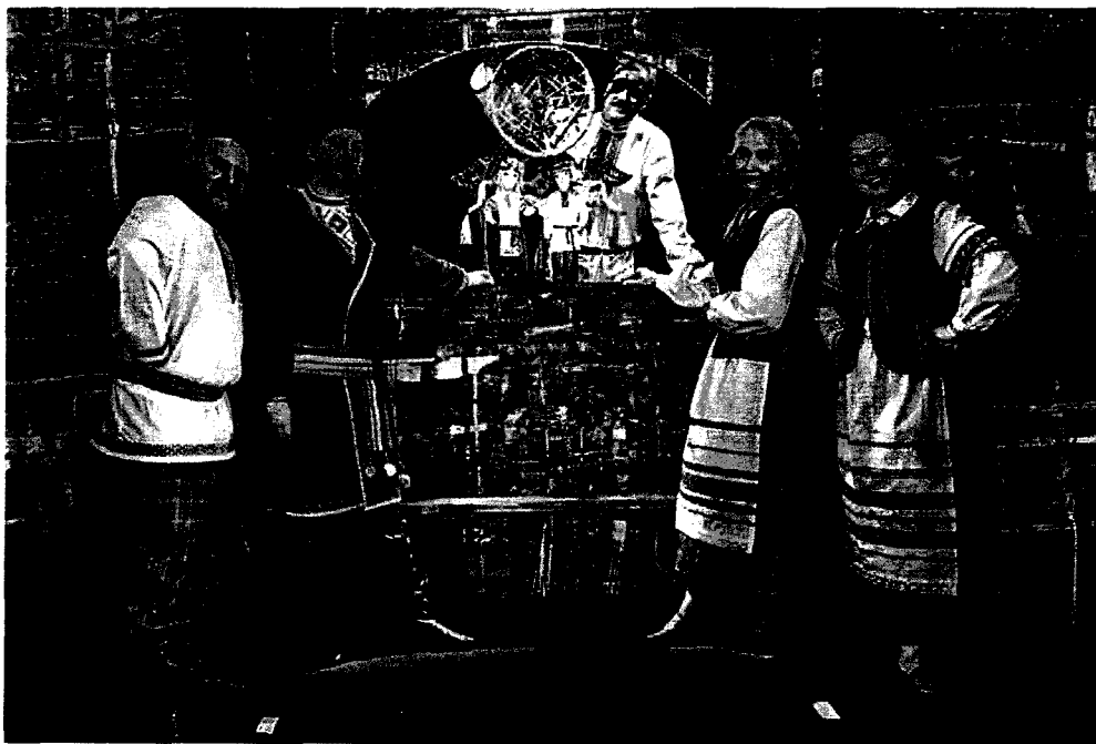
Рисунок 8. Спектакль «Ох и золотая табакерка»

Сценические костюмы, созданные на основе белорусской национальной одежды. В каждом театре кукол Беларуси в репертуаре есть спектакли на основе произведений белорусских писателей, народных сказок и легенд, а также батлейки.