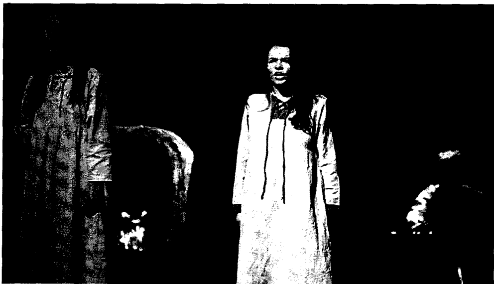
Рисунок 10. Спектакль «Магіла льва»

Заключение. Работа над костюмами куклы-персонажа и актёра-персонажа – специфическая и отличительная черта кукольного театра. В театрах кукол Беларуси костюмы играют особую роль, так как передают характер и индивидуальность каждого персонажа в спектакле. В современном кукольном театре выделяют три типа театрального костюма и развиваются две его группы – реалистический и условно-метафорический. Особое место в сегодняшнем кукольном театре занимает театральный костюм, несущий в себе черты белорусской национальной культуры. Все эти типы и группы костюмов являются важными элементами театрального представления, помогая актёрам и зрителям погрузиться в историю и передать её эмоциональную и смысловую составляющую.