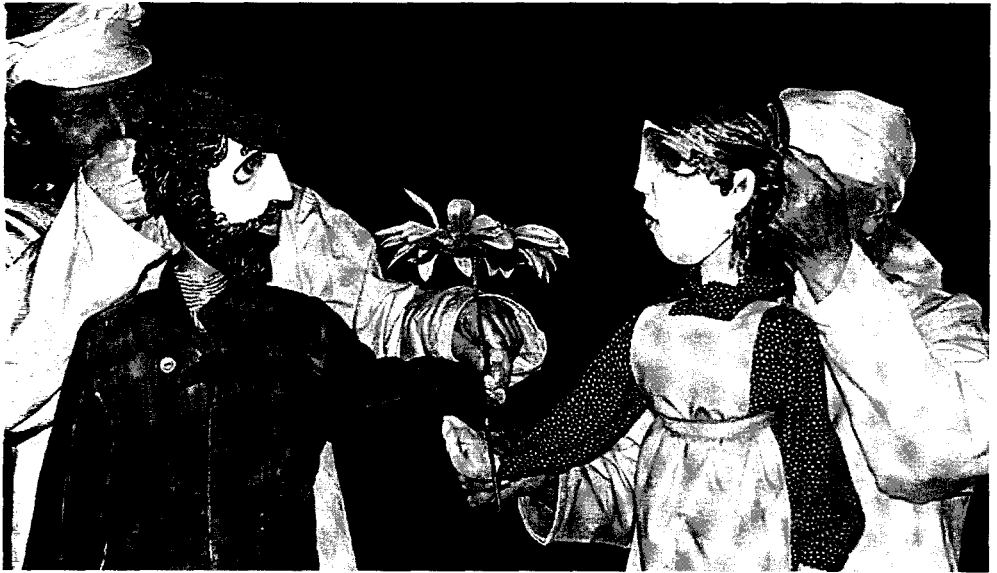
Рисунок 4. Спектакль «Поминальная молитва»

торой происходит действие спектакля. Цвет, детализация, конкретность одежды кукольных персонажей контрастируют с обобщёнными и в чём-то обезличенными образами актёров, не позволяя кукле «пропасть» на фоне живого актёра, акцентируя внимание зрителя на действиях кукол-персонажей.