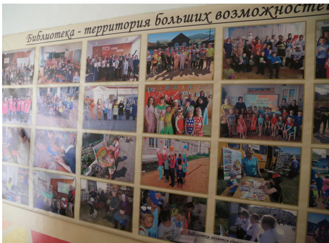
Рис. 2. Библиотека г. Петровск-Забайкальского.

Трубчевская центральная библиотека 1 ведет свою историю с 1898 г., когда земское собрание утвердило Устав и приняло решение о выделении на обустройство библиотеки-читальни средств в размере 62 руб. В первый год в фонде числилось 909 экземпляров. На 1 января 1914 г. в библиотеке насчитывалось 4315 экземпляров книг. Это были книги по естествознанию, сельскому хозяйству, медицине, географии, педагогике, духовного содержания, беллетристика. В настоящее время книжный фонд библиотеки составляет 175 тыс. экз. (2021 г.), библиотека обслуживает около 10 тыс. читателей. Библиотека организовала в течение года 814 мероприятий, в том числе провела ежегодную научно-практическую конференцию в рамках традиционного праздника «На Земле Бояна», конкурс «Человек читающий», тематические беседы и др. [5].