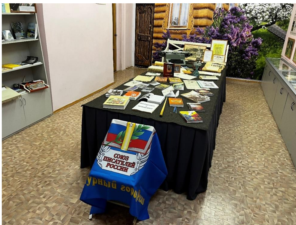
Рис. 3. Музейная комната «Трубчевск – край литературный». Детская библиотека г. Трубчевска.

«...вот у нас музейная комната "Трубчевск – край литературный". Она, кстати, родилась в голове тоже у Степана Павловича [Кузькина] 1 . Потому что он понимал, что есть какое-то наследие поэтическое, литературное, трубчевское, которое надо сохранить где-то» (ТрЖ62) 2