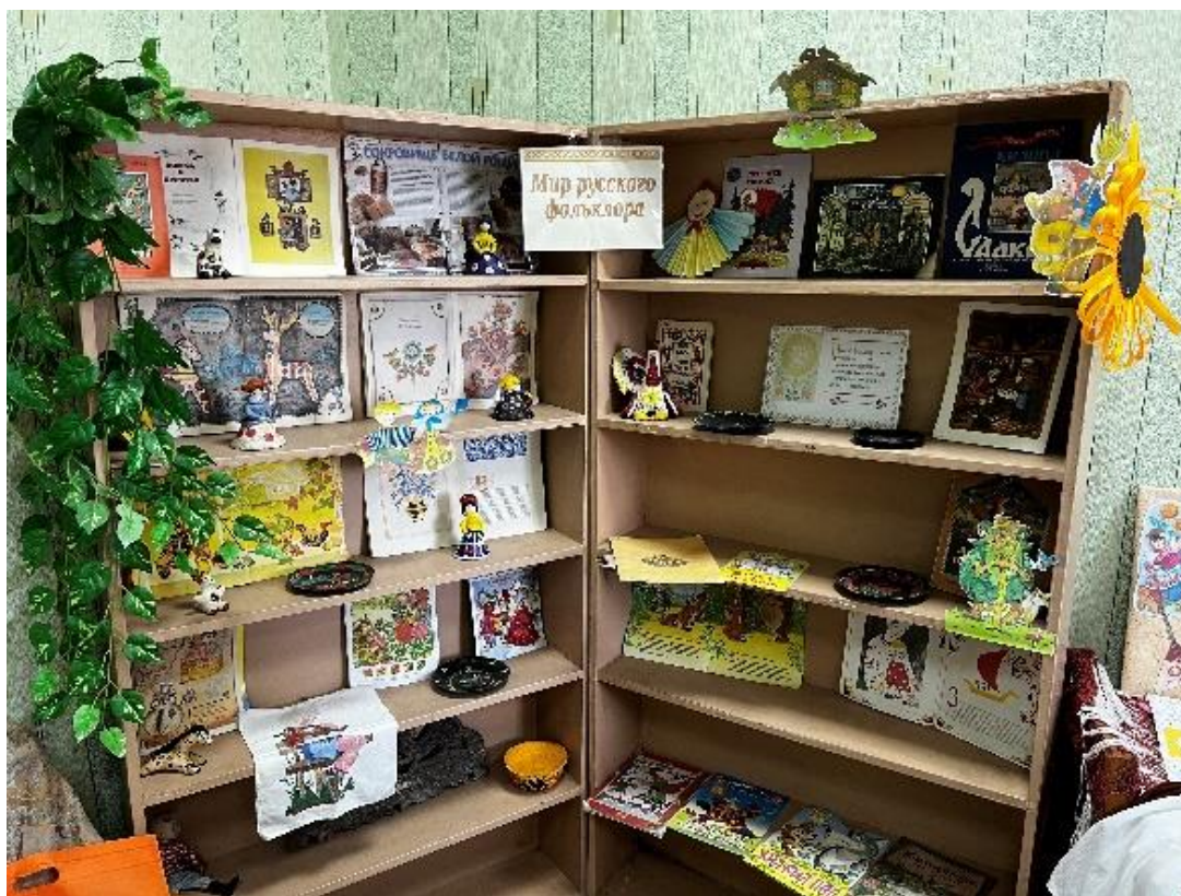
Рис. 5. Выставка «Мир русского фольклора». Детская библиотека г. Трубчевска. Фото из архива проекта

рамках проекта – среди них Пущино, Петровск-Забайкальский, Инта, Котельнич, что свидетельствует о формировании определенных тенденций взаимодействия институтов памяти и интеграции технологий использования историко-культурного наследия.