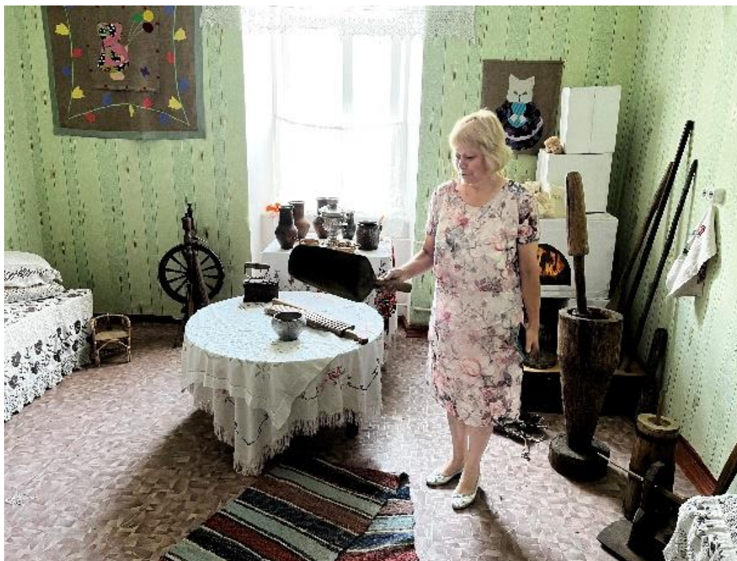
Рис. 4. Музейная комната «Горница». Детская библиотека г. Трубчевска.

Музейная комната «Горница» была оборудована в здании детской библиотеки и представляет собой условную реконструкцию крестьянской избы, где есть картонный муляж печи, стол, кровать, декорированные подлинными вещами (рис. 4):