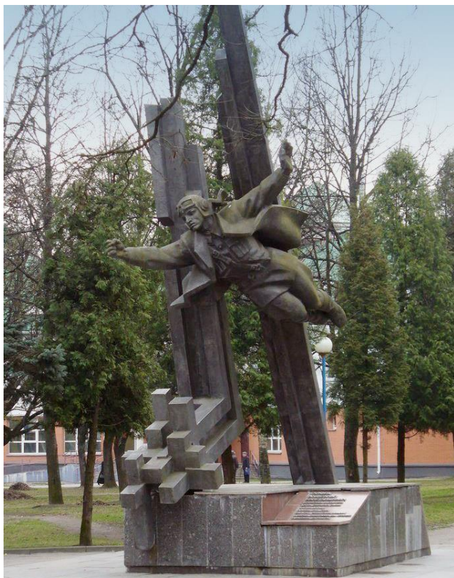
Рис. 6. Памятник Александру Горовцу в сквере Горовца в Витебске

Взлетающий в вечность летчик, руки и лётная куртка распахнуты навстречу ветру. Вся фигура подобна стреле или птице с одного ракурса, и винтообразна – с другого.