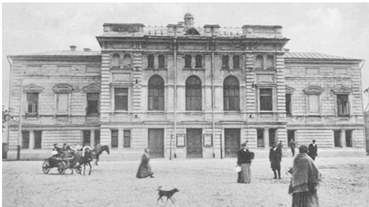
Рис. 2. Здание городского театра в начале XX в.

Оставалось место манежа для выездки лошадей местной жандармской команды. Сама команда помещалась на противоположной, восточной стороне площади в каменном здании, впоследствии приспособленном под «Ростовцовский» театр, а в 1898 г. перестроенном в городской зимний театр.