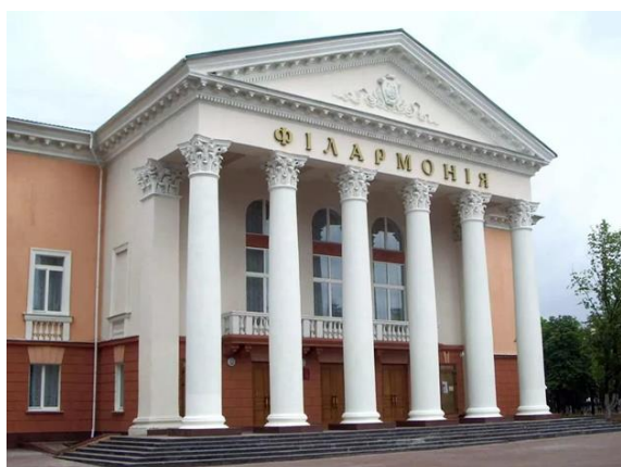
Рис. 5. Здание Витебской областной филармонии. Начало XXI в.

На базе гастрольно-концертного отделения Белорусской государственной филармонии была создана Витебская филармония в 1989 г. В начале 1990-х она разместилась в здании на площади Ленина.