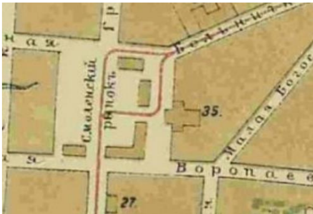
Рис. 1. Площадь Смоленского рынка на плане Витебска 1904 г.

К началу XX в. сохранился большой прямоугольник площади, застроенный кирпичными домами с магазинами и лавками. Эту площадь называли не только Смоленской, но и Смоленский базар.