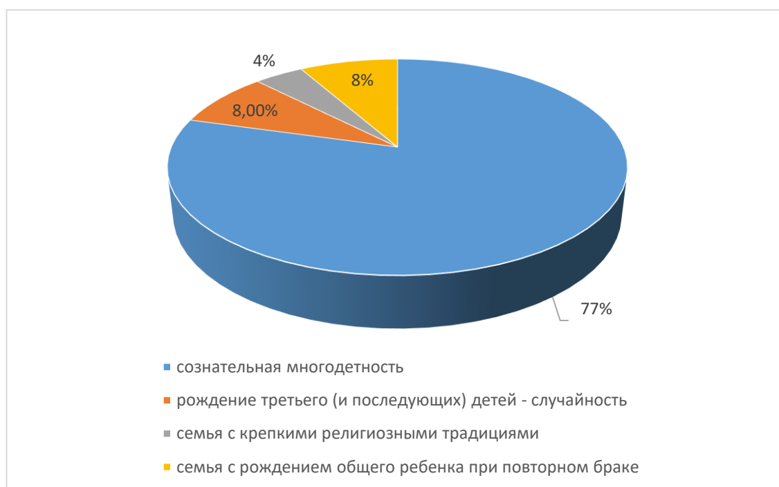
Рисунок 1 – Мотивы создания многодетной семьи

семей 88,55% имеют на воспитании троих несовершеннолетних детей, в остальных семьях воспитывается четверо детей. В ходе проведения анкетирования респондентам был задан вопрос о мотивах планирования многодетной семьи, ответы на который расположились следующим образом: большая часть опрошенных выбрало вариант осознанного родительства (77%), т.е. создание многодетной семьи является сознательным выбором обоих супругов, которые принимают всю ответственность за воспитание ребенка; одинаковое количество (по 8%) респондентов распределилось по следующим группам мотивов – семьи с рождением общего ребенка при повторном браке и рождение третьего (и последующих) детей является случайностью. И самой немногочисленной группой (4%) оказались семьи с крепкими религиозными традициями (данные представлены на рисунке 1).