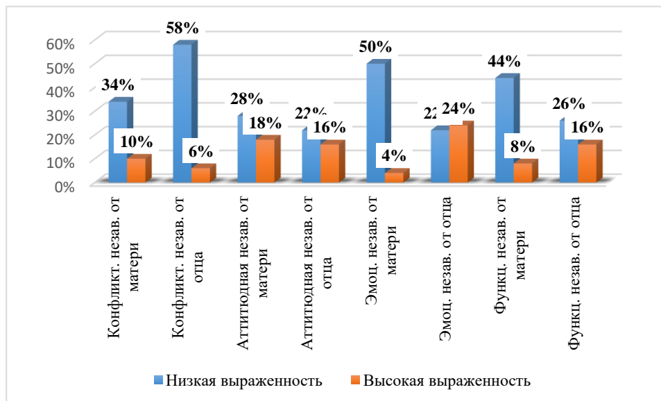
Рисунок 1 – Результаты исследования психологической сепарации от родителей (%)

ной и эмоциональной составляющей. Данные могут быть обусловлены особенностями воспитания девушек: они более эмоциональные, с детства им не было запрещено проявлять чувства и привязанность к родителям.