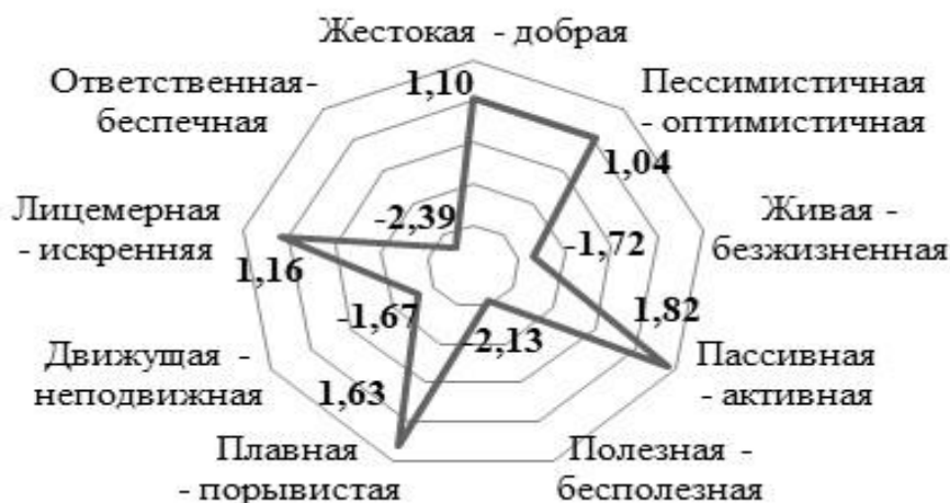
Рисунок 1 – Групповая семантическая универсалия оценки «моя работа»

Модели структуры индивидуального сознания с помощью выделения семантических универсалий и конструкторов, отражающих системные связи между ними. Определены (при 80 и 90% уровнях критериев значимости) слова-дескрипторы, признаки которых являются семантическими универсалиями понятия «моя работа» (рисунок 1). Выделены универсалии: полезная (90%), активная (90%), порывистая (90%), ответственная (90%), добрая (80%), оптимистичная (80%), живая (80%), движущая (80%), искренняя (80%).