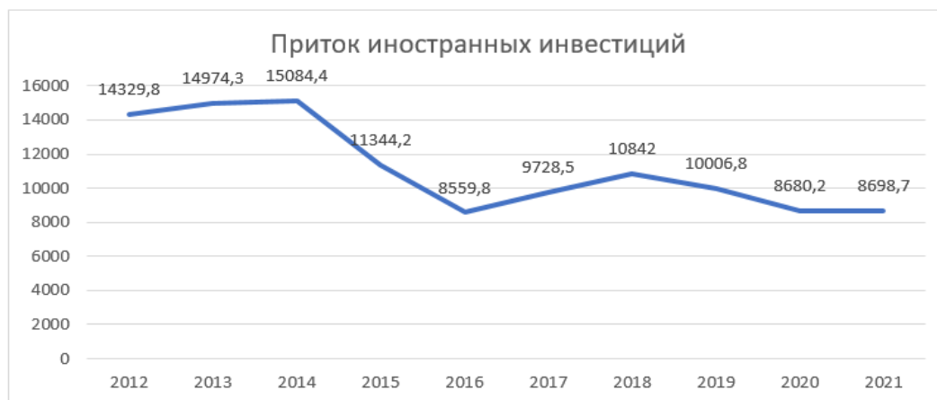
Рисунок 1 – Приток иностранных инвестиций в Республику Беларусь, млн долл. США [2]

Результаты и их обсуждение. На сегодняшний день Республика Беларусь эффективно использует ранее привлечённые иностранные инвестиции, а также реализует многочисленные мероприятия для их привлечения. Однако анализ притока иностранных инвестиций показывает устойчивую тенденцию к снижению поступления средств иностранных инвесторов (рис. 1).