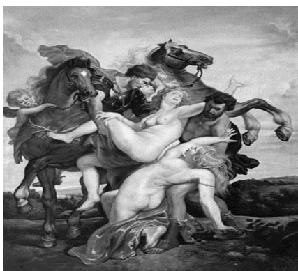
Рисунок 1 – П.П. Рубенс "Похищение дочерей Левкипа"