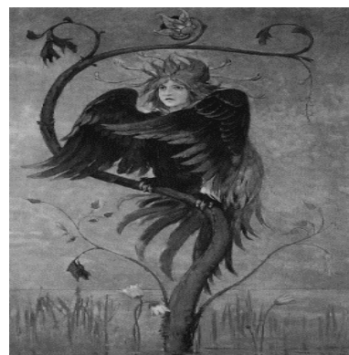
Рисунок 3 – В.М. Васнецов «Гамаюн птица вещая»

Заключение. Мифология является значимым аспектом культуры любых народов, она многообразна и многогранна, а потому её влияние на искусство огромно. На основе мифологии создавались классические сюжеты и архетипы, которыми мы пользуемся и сегодня, формировались жанры. Художественные образы, выстроенные на основе фольклора позволяют тонко выстраивать аллюзии и ассоциации, рассказывать более глубокую историю и выстраивать сложные сюжеты.