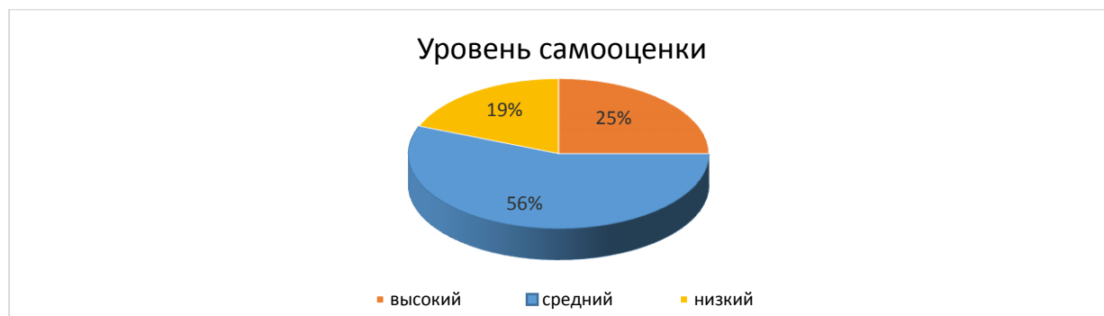
Рисунок 1 – уровень самооценки обучающихся 3 класса

Полученные нами результаты по методике «Какой Я?» свидетельствуют о том, что у всех третьеклассников самооценка сформирована на достаточном уровне. Обучающиеся имеют представление о себе как о личностях. Они могут анализировать свои качества, давать им соответствующую оценку. У подавляющего большинства школьников самооценка находится на среднем уровне развития (56% детей), у части – она стремится к высокому уровню (25% детей), у группы детей младшего школьного возраста выявлен низкий уровень самооценки (19% детей) – рисунок 1: