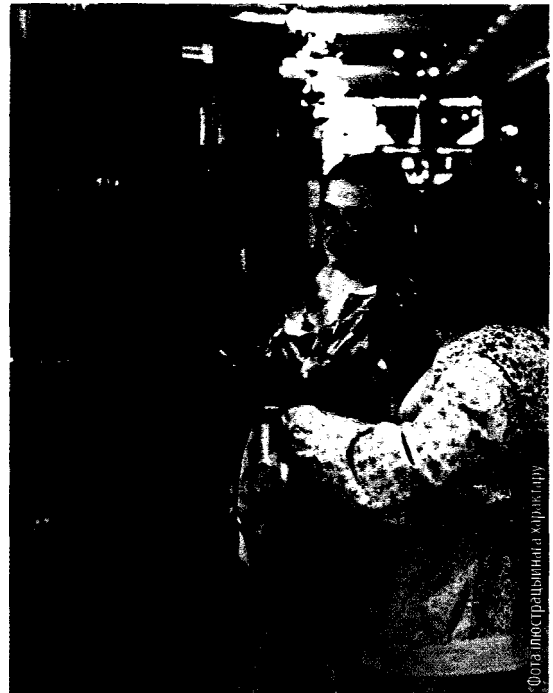
Фота ілюстрацыя ад аўтара

Структурна аповед пабудаваны такім чынам, што пісьмовыя запісы пра эксперымент і яго вынікі, заключныя філасофскія разважанні робяцца Федарчуком тады, калі ён ужо прызнаны псіхічна хворым. Федарчук успрымаецца як адзін з многіх вучоных, дзіця свайго часу, які імкнуўся вырашыць праблемы павышанай значнасці, але вынікі яго дзейнасці прынеслі толькі шкоду. У той жа час трагічны лёс галоўнага героя прымушае чытача задаваць пытанні пра ўплыў навуковага прагрэсу на развіццё грамадства, асэнсоўваць неадназначную ролю навукі, актывізуе ўдумлівы пошук прычын і наступстваў культурна-сацыяльных праблем. У рамана «Кентаўры» прасочваецца маральнае самазнішчэнне галоўнага героя, які займаецца навуковай дзейнасцю, што павінна быць стваральнай па азначэнні.