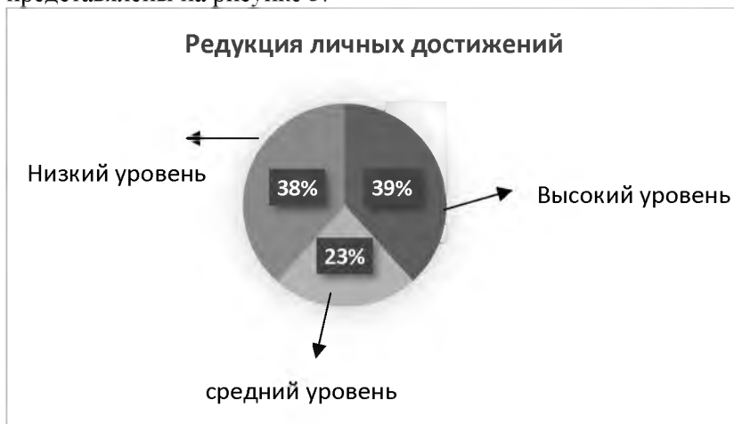
Рис. 3. Результаты по шкале «Редукция личных достижений»

Результаты по шкале «Редукция личных достижений» представлены на рисунке 3.