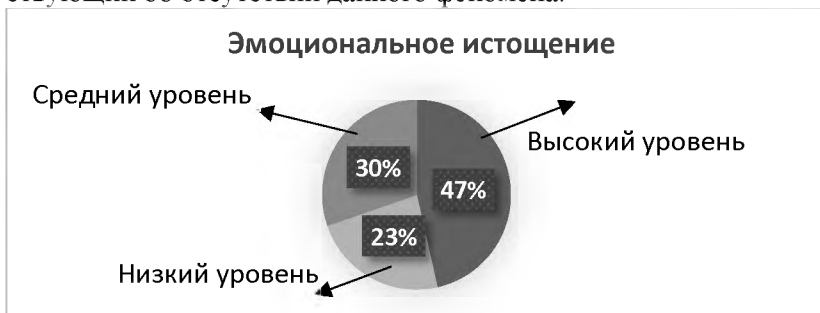
Рис. 1. Результаты по шкале «Эмоциональное истощение»

ного синдрома «выгорания». Они могут проявлять повышенную психическую истощаемость, аффективную лабильность, утрату интереса и позитивных чувств к окружающим, ощущение «пресыщенности» работой, неудовлетворенность жизни в целом; средний уровень составляет - 30%, данный уровень о том, что показатель синдрома выгорания находится в стадии формирования. У 23% испытуемых отмечается низкий уровень, свидетельствующий об отсутствии данного феномена.